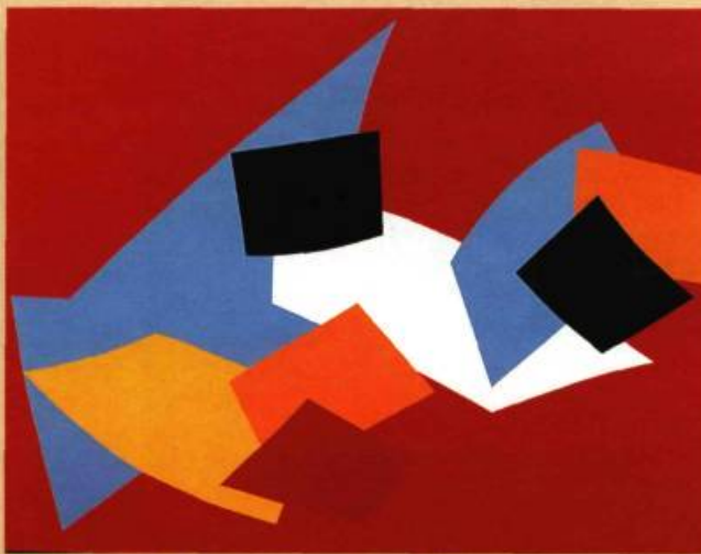
L'oeuvre primée aux Jeux de la Francophonie 1994 (Catégorie Arts) Passes lumineuses Acrylique sur toile, 1994