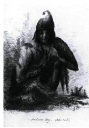
Jeune Amérindien (Carnet II, juin ou juillet 1821)

L'acquisition de ces carnets de croquis pour la somme de