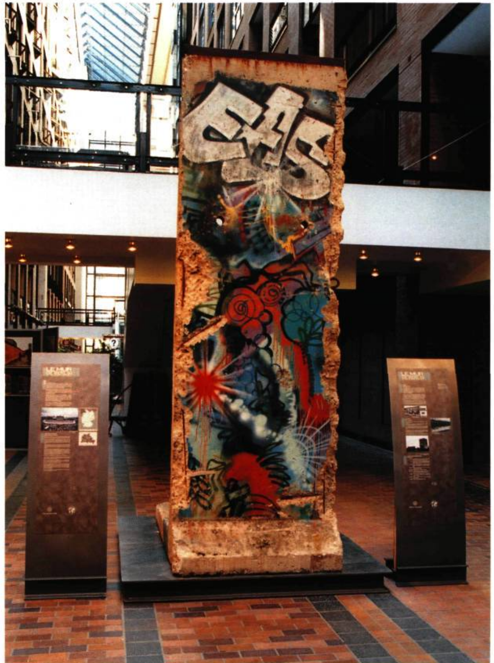
Segment du mur de Berlin Ruelle des Fortifications Centre de commerce mondial de Montréal

Le Centre de commerce mondial de Montréal, plus précisément la Ruelle des Fortifications, carrefour d'échanges internationaux, lieu d'ouverture, de tourisme et de passage semblait tout désigné pour accueillir ce « témoin de l'Histoire » qui est situé à l'endroit où s'élevaient jadis les fortifications de Montréal. Provenant de la Porte de Brandebourg qui symbolise aujourd'hui la réunification de l'Allemagne, le segment de mur, en forme de L, est autoportant et mesure 3,6 m de haut sur 1,2 m de large. Il n'a subi aucune modification. Seule une pellicule protectrice transparente a été appliquée pour éviter l'effritement