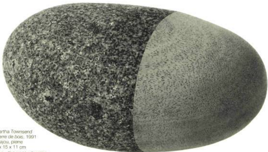
Martha Townsend Pierre de bois, 1991 acajou, pierre 7 x 15 x 11 cm

anthropomorphiques, de François Morelli ; ● les objets ambigus, à la fois abstraits et fonctionnels, de Sarah Stevenson ; ● les formes organiques (tirées d'on ne sait quels corps), quelque peu inquiétantes, de Stephen Schofield.