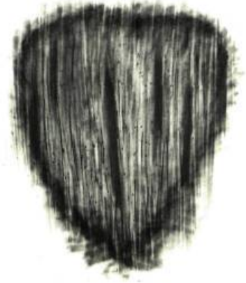
A son cœur XVI, Graphite sur papier, 81 x 61 cm.

blanc est une façon de renouveler un thème communément utilisé et elle crée une parenté avec les masques sombres des cultures africaines ou océaniques; la sobriété voulue amplifie l'impact des dessins, qui ne sont pas sans évoquer les gravures de l'Italien Mimmo Paladino.