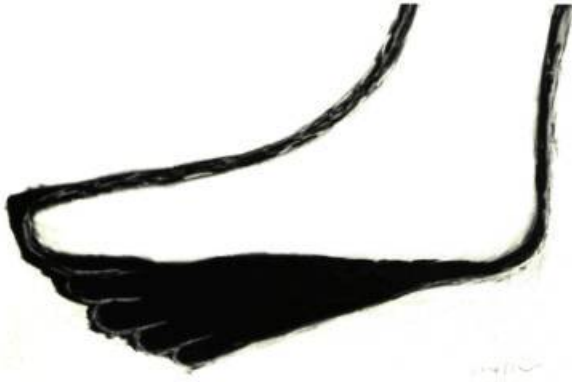
A ses pieds - profil, Graphite sur papier (1993), 81 x 122 cm.