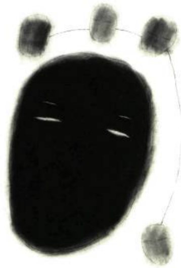
A sa face V, Graphite sur papier, 122 x 81 cm.