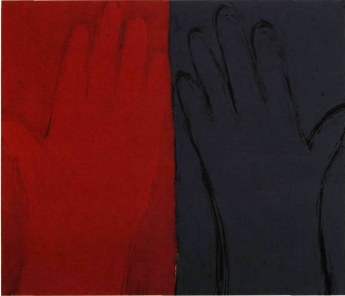
À ses mains III , Acrylique sur toile (1993). 125 x 145 cm.