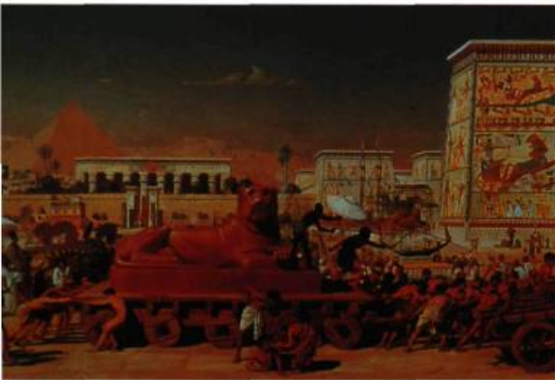
Israëli en Egypte 1867. Sir Edward John Poynter (1836-1919). Huile sur toile. Guildhall Art Gallery, Londres.

Pur délire d'archéologie-fiction, ce péplum à grand déploiement témoigne d'une accumulation invraisemblable de monuments provenant de périodes et de sites différents. Grande Pyramide, temples de Philæet de Gourna, porte monumentale d'Edfou, obélisque d'Héliopolis, temple de Thèbes, figures d'Amenhotep III établies d'après des sculptures conservées au British Museum.