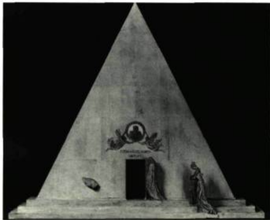
Projet pour le tombeau de Titien. Antonio Canova. (1757-1822) Musée Correr, Venise.

Pur délire d'archéologie-fiction, ce péplum à grand déploiement témoigne d'une accumulation invraisemblable de monuments provenant de périodes et de sites différents. Grande Pyramide, temples de Philæet de Gourna, porte monumentale d'Edfou, obélisque d'Héliopolis, temple de Thèbes, figures d'Amenhotep III établies d'après des sculptures conservées au British Museum.