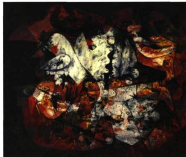
Aigle feu, 1956. Huile sur toile. 73 x 92 cm.