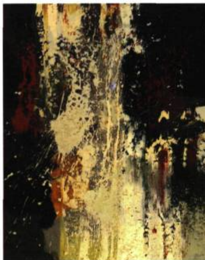
Hochelaga, 1962. Huile sur toile. 81 x 66 cm.