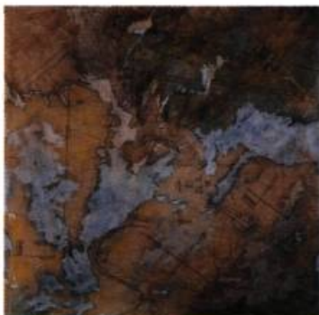
Louise Paillé Anatomie de ma mère - La Terre # 1 , 1988, Techniques mixtes sur papier marouflé, 127 cm x 127 cm.

Alors l'exposition Cartographies variables , est-ce un échec ou un demi-échec? Ni l'un ni l'autre. En proposant ainsi une synthèse des modèles d'association-opposition des cartes de géographie à des œuvres de création visuelles, l'exposition atteint un but qu'elle ne visait peut-être pas. Elle montre les limites et, par là, dresse une critique du commentaire de l'espace géographique par les langages propres aux arts plastiques. Ceux-ci, par le détour des mappemondes, retrouvent leur spécificité: unique et plurielle, ponctuelle et infinie, échappant à toute mesure. se jouant de toute taxonomie. Une belle surprise. Un succès inespéré. □