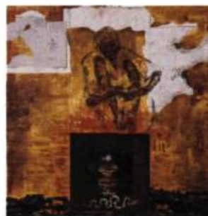
Bernard Gamoy Géographie/ Destinée , 1989, Huile et technique mixte sur lin écossais, 173 cm x 173 cm.

Dans les œuvres exposées, la majorité des artistes n'exploitent pas ce décalage inhérent aux objets et aux langages qu'ils superposent ou qu'ils juxtaposent. Au contraire, ils imposent et surimposent «leurs messages». Leurs pièces font figure de simples exercices en ceci qu'elles semblent se contenter d'illustrer une intention voire un projet pédagogique. Ce n'est déjà pas si mal : après tout, ne