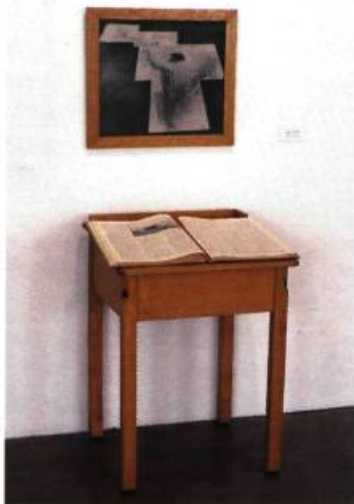
Dominique Blain Contemporanea Aequals, 1989, Pupitre d'écolier, livre, émulsion sur film, 143 cm x 53 cm x 56 cm.

sommes-nous pas dans la galerie d'un établissement d'enseignement? Mais ce faisant, ils escamotent la subtilité et la fragilité du jeu entre le vrai et le faux, entre les illusions et les incertitudes, entre la réalité et le rêve. Leur manœuvre trop visible, trop explicite, trop carrément idéologique parfois, déçoit et détourne le spectateur qui entend préserver sa liberté. Liberté de voir, de penser et même de juger.