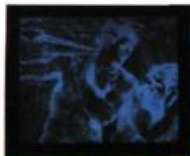
Barbara Steinman Exile , 1990, 2 épreuves cibachrome, 52,8 cm x 63 cm et 137 cm x 113 cm, Coll.: Prêt d'œuvres d'art du Musée du Québec, Québec.