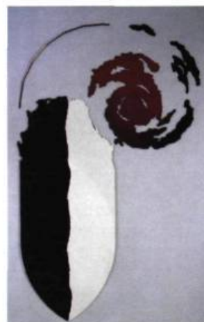
Jocelyn Jean Indications diverses # 10 , Au pied de l'arc-en-ciel , 1987, Émail sur métal, huile sur contreplaqué, acrylique sur contreplaqué, 3,35 m x 1,90 m.