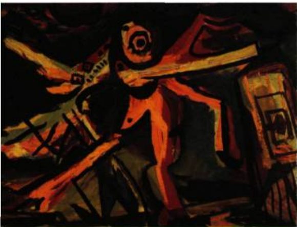
Sans titre, n.d., Huile sur toile, 23,9 x 33,1 cm, Coll.: Musée d'art contemporain de Montréal.

artistiques novateurs de l'Europe des années trente, et le climat intellectuel québécois des années quarante marqué par l'idéologie du «rattrapage culturel» éclairent les réponses données par Sandra Grant-Marchand. Enfin, le conflit Borduas-Pellán est analysé en regard des attitudes divergentes des deux artistes face au surréalisme français.