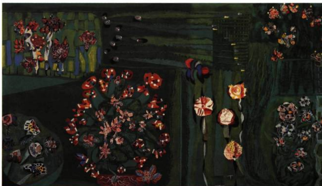
Jardin vert , 1958. Huile, polyfilla sur toile, 104 x 186,3 cm, Musée du Québec, Québec.

Si le Musée du Québec a toujours été partie prenante dans les manifestations Pellan depuis 1940, lors du retour de