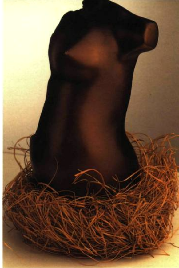
IL NIDO, 1992, bronze et foin, 21 x 16 x 14 cm.