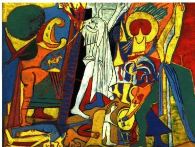
Pablo Picasso, La Crucifixion , 1930, huile sur contreplaqué, 51,5 X 66,5 cm, Paris, Musée Picasso.

J.C. : C'est la volonté de passer par une expérience limite qui est aussi celle de la peinture. L'artiste peut se considérer comme un crucifié de la société. C'est une tradition que l'on peut faire remonter au Romantisme et au tout début de la modernité. Il faut considérer également l'arrière-fond psychologico-sociologique présent chez les artistes qui les rend, sans doute plus que quiconque, aptes à comprendre le sens de la crucifixion car plus personne, aujourd'hui, n'a une réelle idée de ce qu'est le sacrifice.