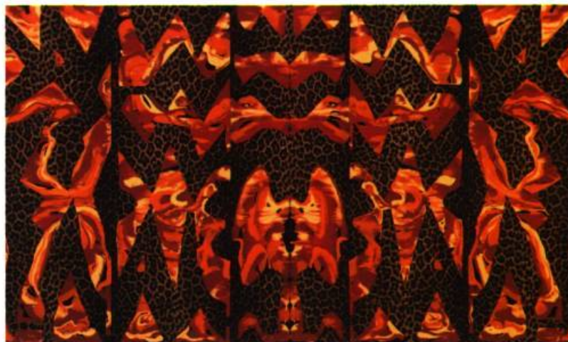
Masque marbré , 1990, Acrylique et collage sur toile, 122 x 203 cm.

Son œuvre s'est développée en un amalgame et une synthèse des courants qui ont marqué l'histoire de la peinture contemporaine. Hurlubise utilise l'expérience de la peinture comme une métaphore de la réalité. Tracés picturaux, distances, reculs sont pris en considération afin de « donner vie » à un tableau dont l'élaboration ne se conçoit, pour l'artiste, que sur un registre héroïque. L'œuvre d'art est tout autant une