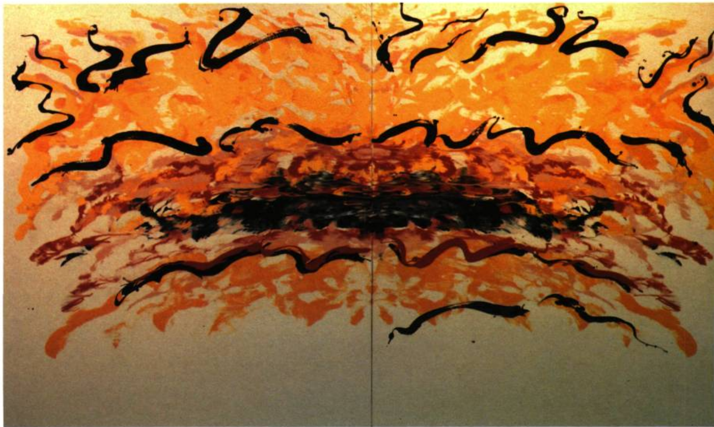
Flywingo , 1983. Acrylique sur toile, 178 x 305 cm.