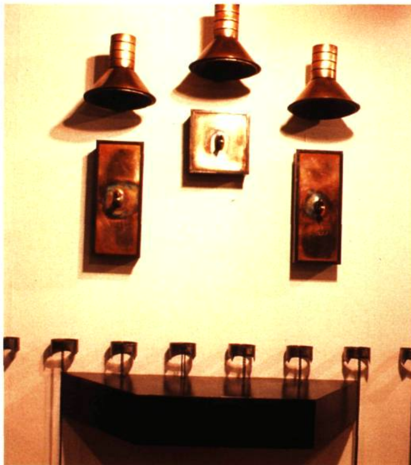
Bearings & Demeanor , 1990. Cuivre, acier et résine.