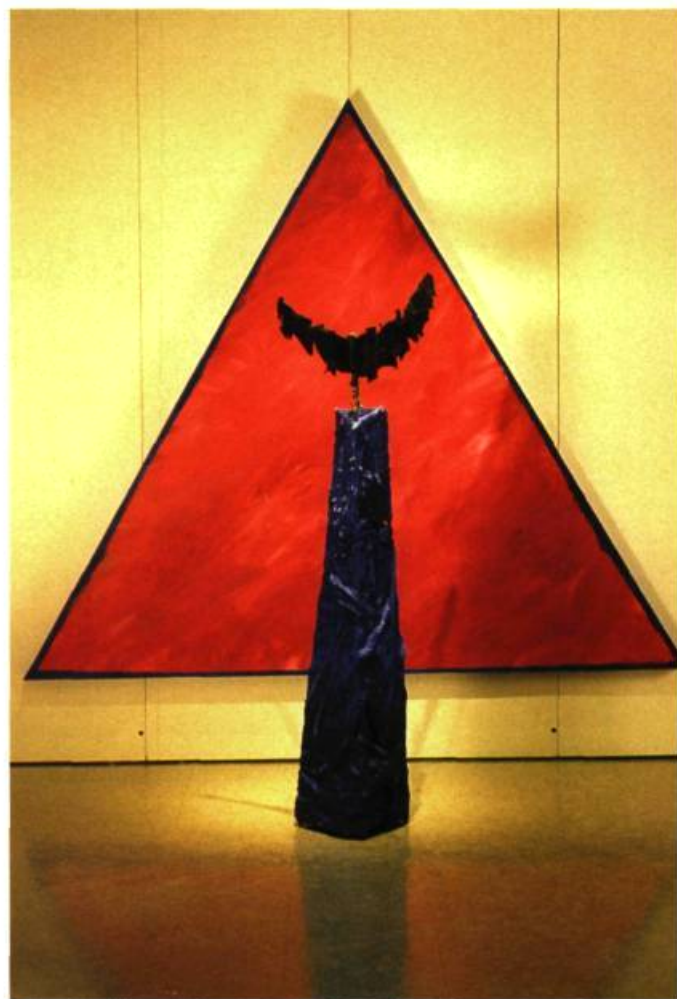
Conquistador, 1991, Techniques mixtes, 193 x 193 x 91 cm.