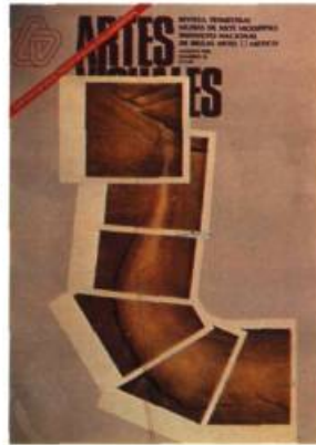
Artes Visuales, Mexico.