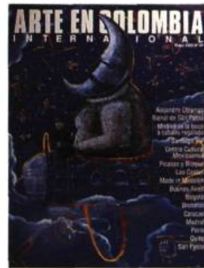
Arte en Colombia, Bogotá.