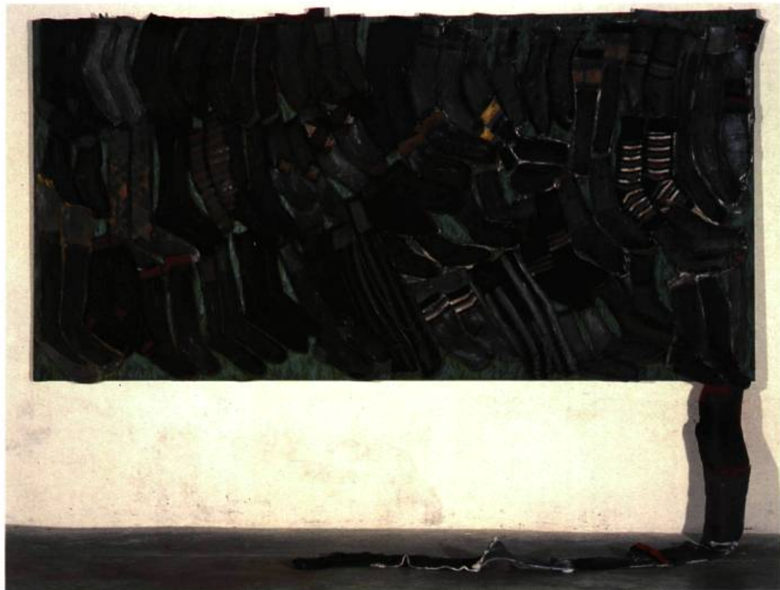
Leda Catunda, Chaussettes, 1989, Acrylique sur chaussettes, 132 X 257 cm, Coll. Marcantonio Vilaça, S. Paulo, Photo: Eduardo Brandão.

du moment. Le Salon national d'art moderne de la même année reflétait également la nouvelle peinture gestuelle, éclatante et colorée.