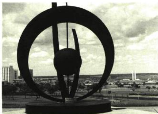
Vue panoramique à partir de l'Édifice de la Télévision.

En attendant de passer à l'histoire, tout comme Brasilia, peut-être, Oscar Niemeyer poursuit son œuvre: le projet d'un pont à Venise, la Maison de la musique à Paris, un dernier édifice à Turin. Le Brésilien croit à une architecture libérée des contraintes de la