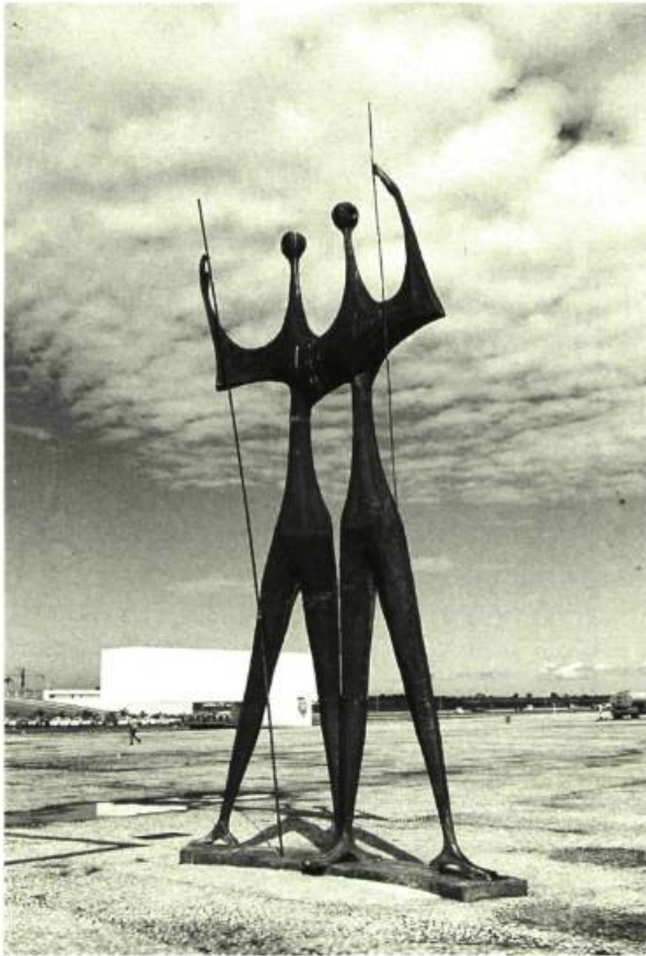
Monument du Candango.

-O.N.: J'ai voulu faire les choses le plus librement possible. Je ne me suis pas préoccupé du tout du fonctionnalisme, ni de rationalisme. Personnellement, j'ai toujours eu envie de passer outre à la standardisation. Mon but, d'abord et avant tout, était d'utiliser le béton d'une façon intelligente et nouvelle. Et quand on a un grand espace à construire en béton, c'est la courbe qui s'impose, qui devient la so-