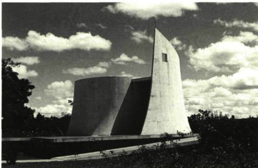
La Chapelle du Palais d'Alvorada.

-O.N.: Il aurait sûrement été possible pour moi d'arriver à autre chose avec Brasilia. Il faut accepter que tout est possible. Cependant, le futur connaît ses contingences et reste une réalisation difficile. Mais vous savez, ce qui a marqué l'évolution de l'architecture, ne sont pas les petites maisons toutes jolies, toutes simples; ce sont les cathédrales, les grandes structures où l'on remarque une lutte pour créer de grands espaces. Nos vieux maîtres archi-