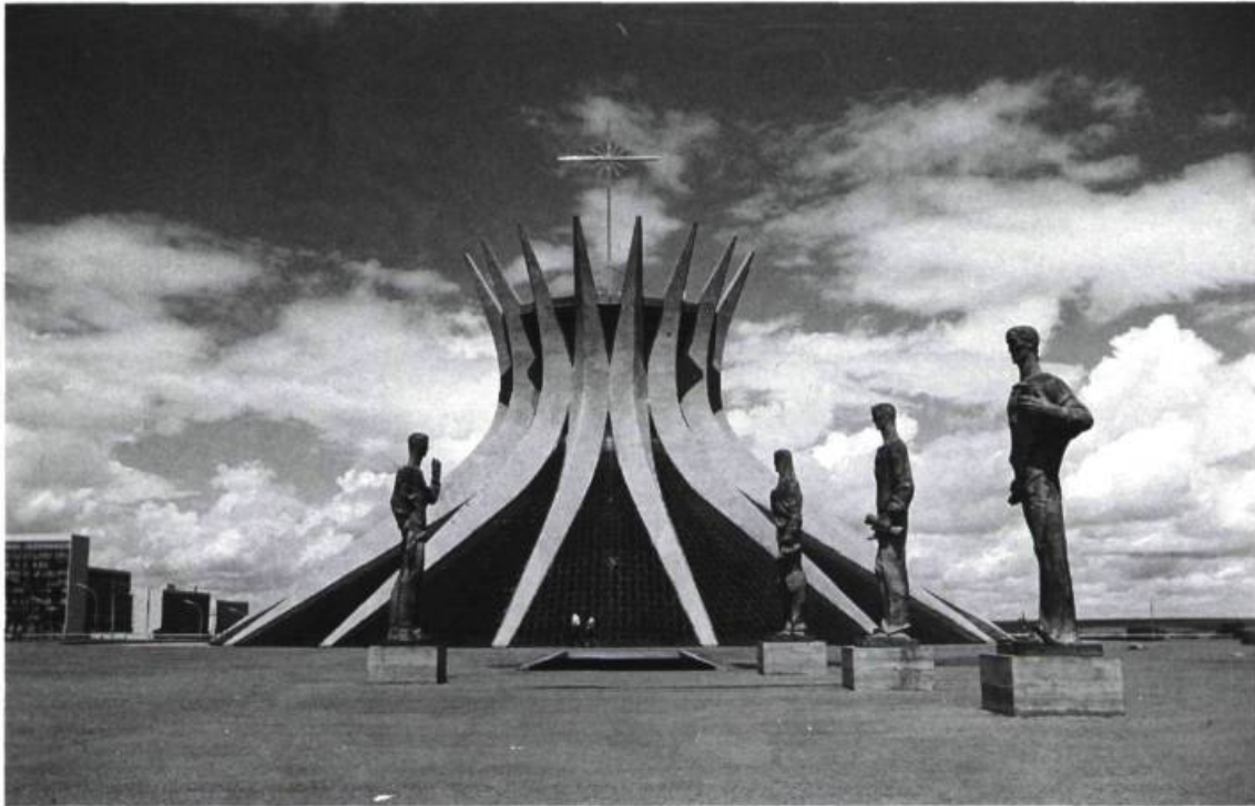
La Cathédrale de Brasilia.

- O. N.: Le gouvernement veut tenter de réduire l'occupation de la ville. Mais les gens qui vivent dans la capitale ne veulent pas partir, malgré ce que les cri-