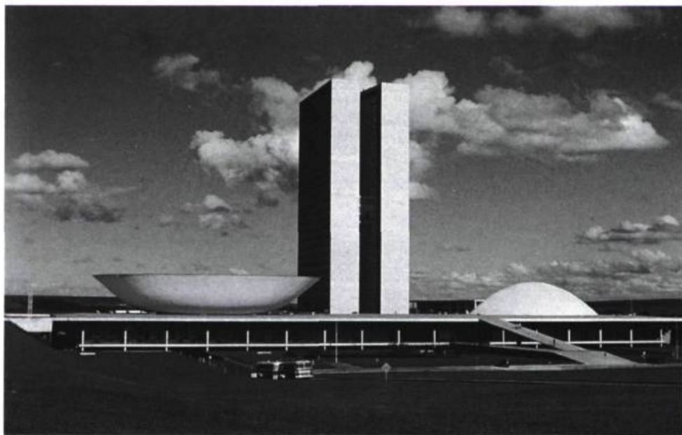
Assemblée nationale.

-O.N.: Oui. Ce qui compte, c'est de lutter contre la pauvreté, dans tous les sens du terme, être bien avec nous-mêmes, et chercher à améliorer les choses. J'ai été impliqué plusieurs fois au niveau politique, ce qui est très important pour moi; être à côté du peuple, dénoncer le militarisme, la dictature et prendre position pour être avec le peuple du Brésil. Mais je ne dissocie pas vraiment cette implication de mon travail. Je viens tout juste de terminer, à Sao Paulo, le Mémorial de l'Amérique