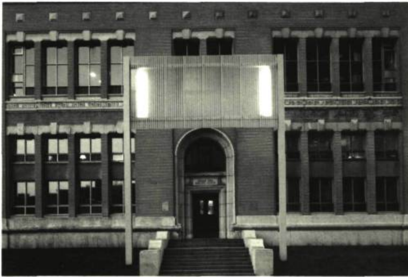
Interface, 1989. Maison du Conseil des Arts de la Communauté urbaine de Montréal.

invention du philosophisme actuel... qui veut y voir clair dans l'histoire doit avant tout éteindre ce fanal perfide, feu follet sans aucune garantie pour demain...» S'agirait-il de mettre un terme à l'accumulation des scories du passé? Dans le langage du cinéma, Dallégret nous donne cet avertissement: «...le progrès ne nous autorise guère l'arrêt sur l'image... Figés par notre éducation et victimes de nos guerres de religion, on nous avise d'une société de l'opulence, d'un productivisme insensé et d'une suralimentation sans bornes... inflation de l'information et faillite de l'éthique appellent alors l'inertie et le jeûne...»