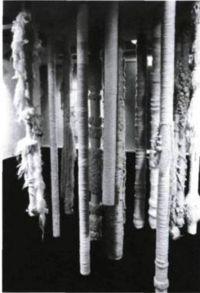
Forêt, 1977. 241 x 159 x 154 cm.