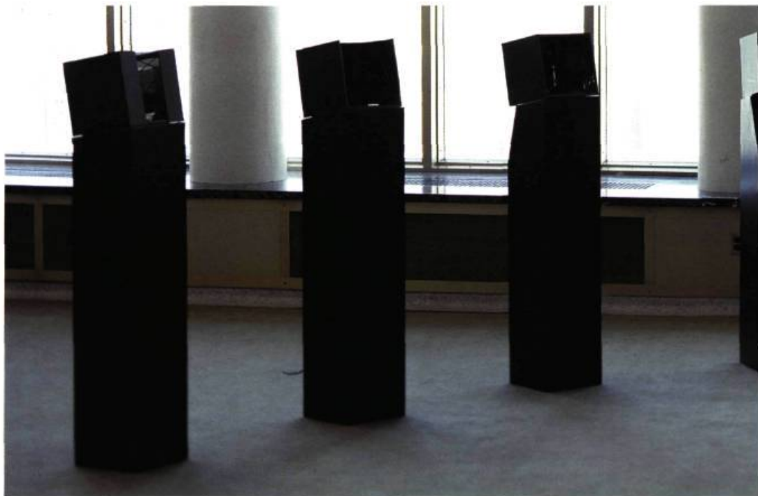
9/Noir, 1989. Installation pour Les Événements du Neuf à la Salle Claude Champagne. Chaque stèle: 150 x 28 x 28 cm.