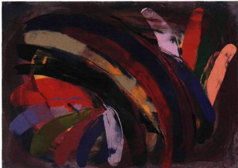
Nuit africaine , 1989. Acrylique sur toile; 120,7 x 169 cm.

lections canadiennes et étrangères; elle fait régulièrement partie des importantes expositions à thème, telles Les Femmeuses, et, au printemps dernier, Déplacements à la Maison des arts de Laval; elle a été plus d'une fois l'invitée