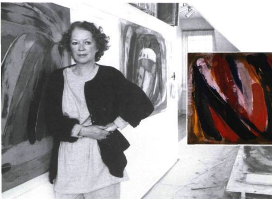
Vénitienne , 1989. Acrylique sur toile; 172,7 x 193 cm.

C'est en 1975, l'année où elle représenta le Canada au Festival international de la Peinture, à Cagnes-sur-Mer, que j'ai vu, pour la première fois, des œuvres de Michèle Drouin. Elle avait exposé à Paris, dans une galerie de Montparnasse, la Galerie Galatée, un ensemble de tableaux aux couleurs vives, sortes de ballons flottant dans l'air, ludiques un peu, à la Miró.