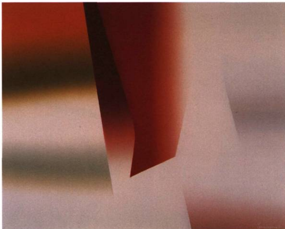
Champs cosmogènes, Série A No I, 1986. Huile sur toile; 130 x 162 cm. Coll. Trust Royal.

d'ordre, fussent-ils appels aux libérations de toute sorte.