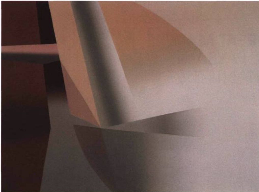
Structures cosmophages, Série C No 3, 1987 Huile sur toile; 97 x 130 cm.