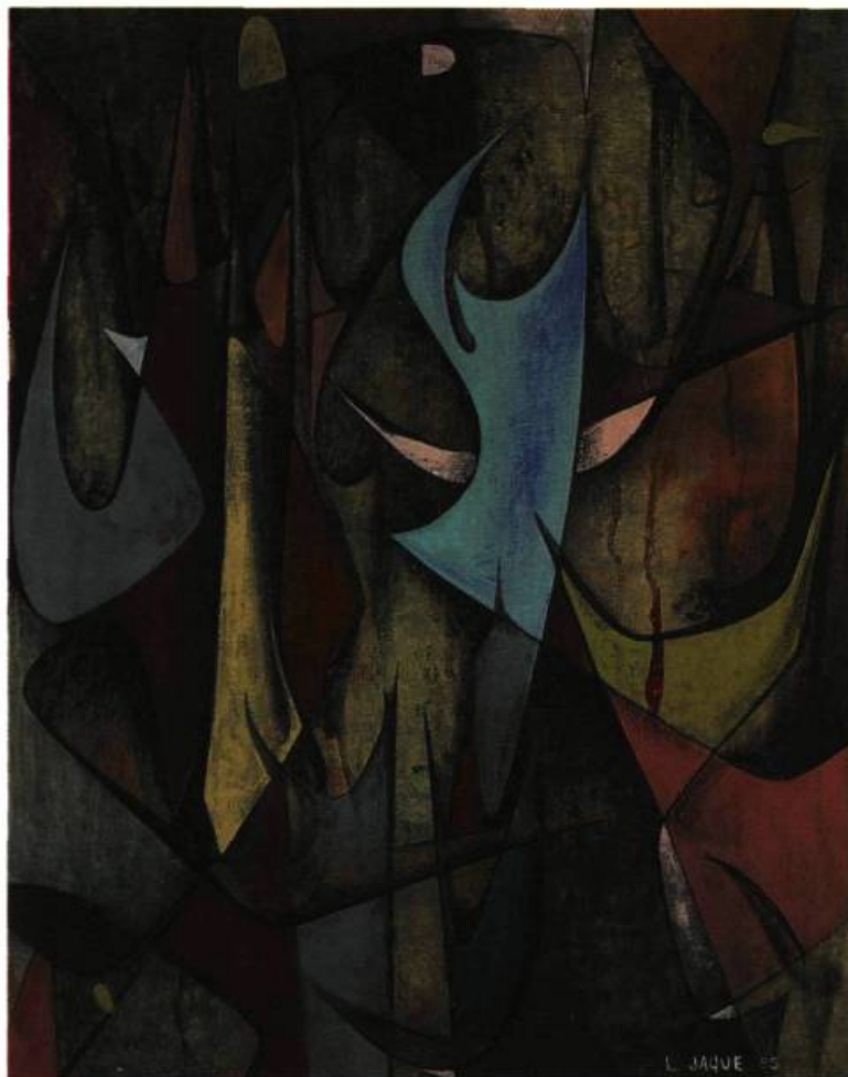
Minotaure et le héros d'argile, 1955. Gouache; 55,8 x 71,2 cm. Montréal, Coll. particulière

Les statues de Dédale sont presque exclusivement des xoana, images taillées dans le bois. Sa réputation mythique fait de lui le maître du bois, inventeur de la statuaire antique, et le constructeur du labyrinthe qui porte son nom, donc aussi le patron des architectes.