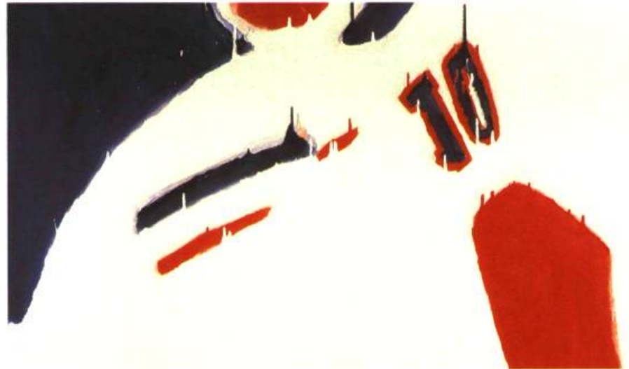
Lafleur Stardust , 1975. Acrylique sur toile; 101,6 x 172,7 cm. Montréal, coll. Loto-Québec.

Parlant de Borduas, Lemoine s'interroge. Pourquoi l'exposition que lui a consacrée le Musée des Beaux-Arts ne voyage-t-elle pas, ni en France, où il a fini sa vie, ni ailleurs au Canada – puisqu'il est en principe un artiste canadien important? Question qui en suscite d'autres chez lui. Pourquoi n'y a-t-il pas d'exposition permanente qui soit consacrée aux automatistes et aux plasticiens? A New-York, le Museum of