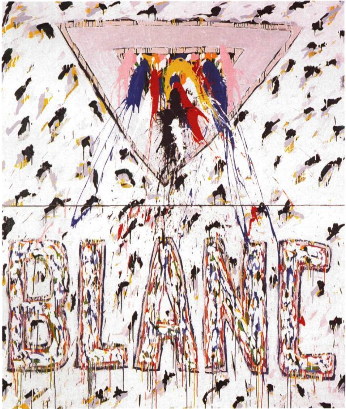
Blanc , 1984. Acrylique sur toile; 275 x 229 cm. Musée du Québec.