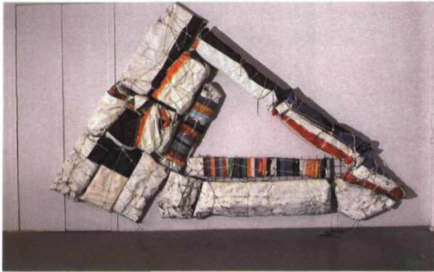
Station I - Hommage à Christo Trilogie d'un triangle noir, 1987. Acrylique sur toile, corde et tapis; 277 x 487 x 32 cm. Coll. de l'artiste.