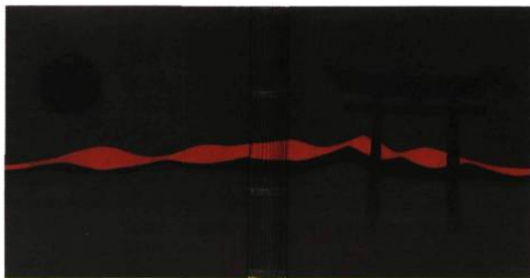
Louise Genest-Côté Soleil de Jade , d'André Suarès. Reliure à couture apparente, plein veau vert mosaïqué.