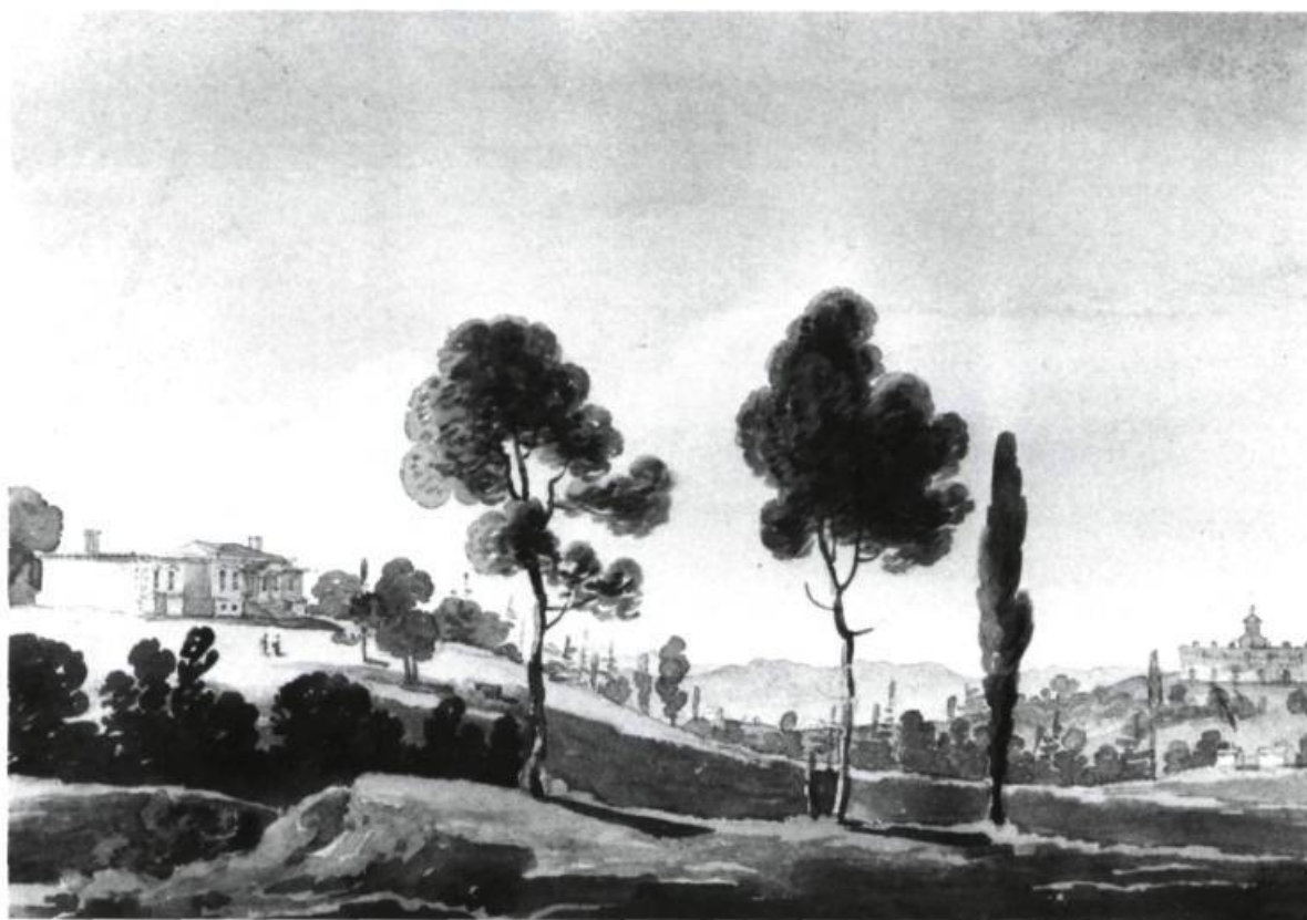
La Maison de campagne du juge en chef Blower, près de Windsor, Nouvelle-Écosse, 1807. Aquarelle sur crayon; 13 x 18,3 cm.