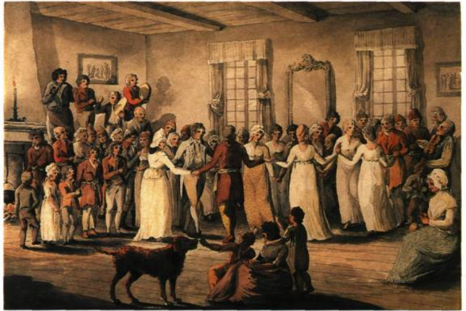
Bal au Château Saint-Louis, 1801. Aquarelle sur crayon; 24,7 x 36,8 cm.

Sandby à l'Académie de Woolwich, produisirent d'intéressantes, de ravissantes esquisses. Mais Heriot le romantique, qui cherchait son Arcadie sur cette terre qu'il découvrait, fut, entre tous, le véritable artiste. Et comme nombre d'artistes, il avait peine à concilier son tempérament avec les exigences de ses fonctions au sein d'un service public.