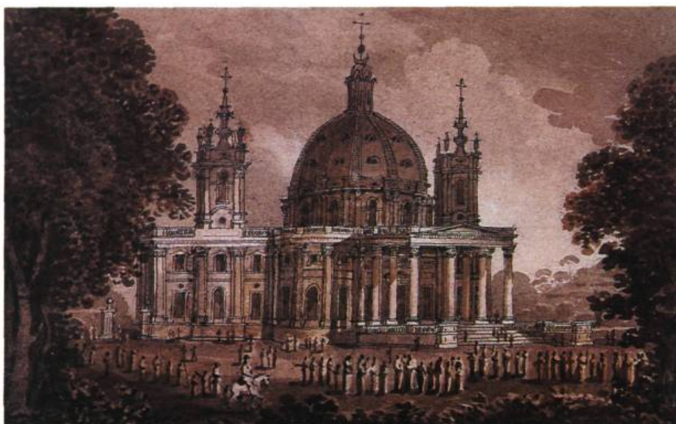
La Superga, près de Turin, 1817. Sépia, plume et encre sur crayon; 11 x 17,1 cm.

near Point Levis. Les figures deviennent plus naturelles et, dans les jeux de lumière, transparait une vigueur nouvelle. A cet égard, Finley signale une série de six aquarelles de paysages nord-américains pittoresques, connue sous le nom d' Edy-Fisher prints , et qui semble avoir eu une influence très nette sur une œuvre d'Heriot intitulée Cataract of the River La Puce , datant d'environ 1799.