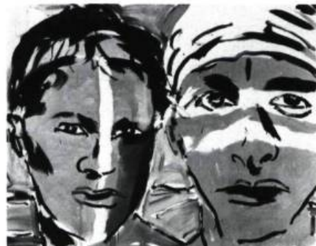
Luciano CASTELLI Coll. The Chase Manhattan Bank

THE MUSEUM OF MODERN ART, 11, 53 e Rue Ouest. Du 22 mai au 26 juillet: Paul Gauguin et l'École de Pont-Aven, Gravures; Du 4 juin au 8 septembre: Berlinart , Travaux de 1961 à 1987; Du 18 juin au 18 août: Iliazd et le livre illustré ; Du 25 juin au 15 septembre: Mario Bellini, Designer; Du 2 juillet au 29 septembre: William Rau, Photographies sur les chemins de fer; A partir du 6 août: Gravures surréalistes de la Collection du Musée; A partir du 10 septembre: Henri Cartier-Bresson, Photographies; Jusqu'au 22 septembre: Gravures contemporaines américaines.