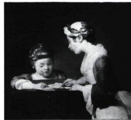
Jean-Baptiste Siméon CHARDIN

THE NATIONAL GALLERY, Trafalgar Square. Du 17 juin au 16 août: Lucien Freud, Le Regard de l'artiste .