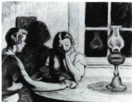
John LYMAN Coll. Paula et Danny Bercovitch

LONDON REGIONAL ART GALLERY, 421, rue Ridout Nord. Jusqu'au 14 juin: Nick Johnson; Du 19 juin au 2 août: La Guilde des Poters de London, Ontario; Jusqu'au 6 juillet: L'Art et l'eau; Du 10 juillet au 16 août: John Lyman, Rétrospective; Du 13 juillet au 13 septembre: Les Artistes de London, Ontario; Du 28 juillet au 30 août: Le 100 e anniversaire de naissance de Marcel Duchamp; Jusqu'au 30 août: 75 e anniversaire de l'H.B. Beal Technical School; A partir du 4 septembre: Ian Carr-Harris, Moving Images ; A partir du 5 septembre: Henry Hines, Photographies sur London, Ontario, de 1905 à 1930; A partir du 12 septembre: Clark McDougall, Rétrospective.