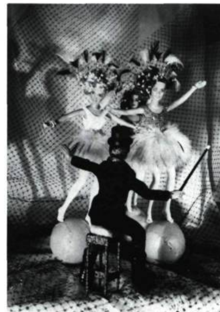
Ellen BROOKS Coll. Musée d'Art Contemporain de Montréal

GALERIE WALTER PHILLIPS, Centre Banff. Jusqu'au 14 juin: La Magie de l'image ; Du 19 juin au 19 juillet: Wild Rose Country (artistes de l'Alberta); Du 24 juillet au 14 août: Les Artistes en résidence du Centre Banff, Céramiques, peintures, textiles et sculptures; Du 4 au 30 août: Vidéo Theatrics .