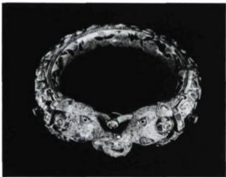
Bracelet éléphant, Indes

MUSÉE DES BEAUX-ARTS DE L'ONTARIO, 317, rue Dundas Ouest. Du 27 juin au 6 septembre: Jessie Oonark, Rétrospective; Jusqu'au 28 juin: Joyce Wieland, Rétrospective; Jusqu'au 12 juillet: Betty Goodwin, Acquisitions récentes de gravures et de peintures; Du 18 juillet au 13 septembre: Thomas Rowlandson, Gravures et aquarelles; Du 18 juillet au 27 septembre: David Salle; A partir du 24 juillet: France Loring (1887-1968) et Florence Wyle (1881-1968), Rétrospective de sculptures.