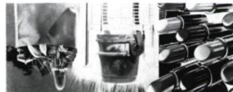
James ROSENQUIST Don des Fonds Arthur Hoppock Hearn, George A. Hear et Lila Acheson Wallace

THE METROPOLITAN MUSEUM OF ART, 82 e Rue et 5 e Avenue. Jusqu'au 21 juin: Chefs-d'œuvre impressionnistes et post-impressionnistes de la Collection Courtauld, de l'Université de Londres; Jusqu'au 2 août: Calligraphie et peintures des dynasties Sung et Yuan; Jusqu'au 16 août: Gustave Le Gray et Henri Le Secq, Photographie; Jusqu'en septembre: Dessins exceptionnels, du 15 e au 20 e siècle; Jusqu'au 6 septembre: La Danse et les costumes.