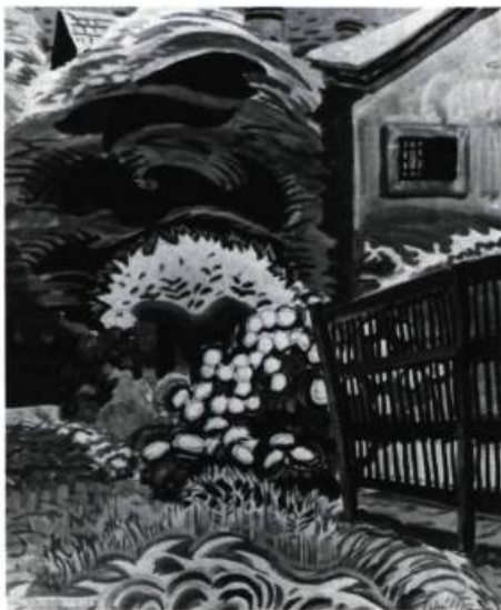
Charles BURCHFIELD Coll. Whitney Museum of American Art, New-York

A partir du 28 juin: Un siècle de sculpture de la Collection Patsy et Raymond Nasher; Jusqu'au 26 juillet: Dessins italiens de la Collection Royale Britannique; A partir du 6 septembre: William Merritt Chase, Êtes à Shinnecock, Long Island, de 1891 à 1902 (peintures et sculptures); Berthe Morisot, Rétrospective ; Jusqu'au 7 septembre: Dessins et aquarelles américains du 20 e siècle de la Collection du Musée Whitney; Jusqu'au 27 septembre: Andrew Wyeth, The Helga Pictures (dessins et aquarelles).