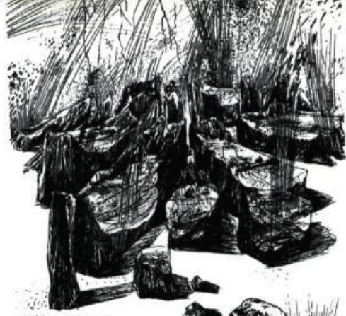
FRONT VIEW - ELEVATION.