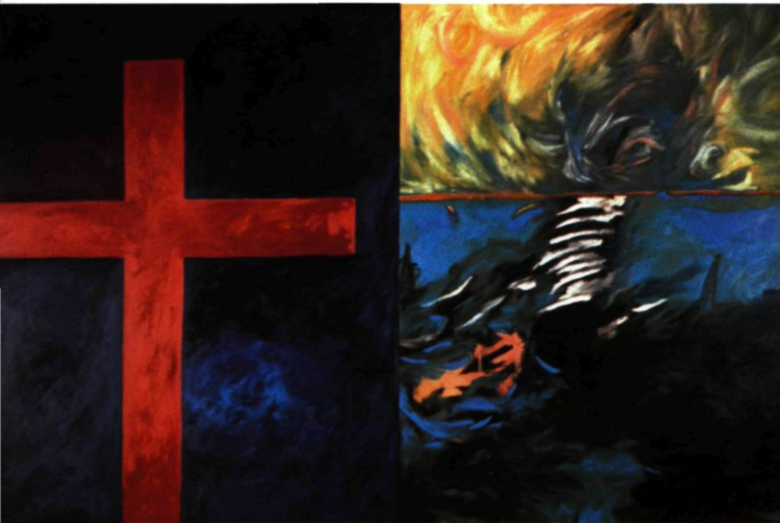
1. Allyson CLAY Cross by the Sea , 1985. Huile sur toile (2 panneaux); 272 cm 8 x 425,2.