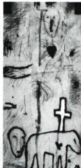
6. Mimmo PALADINO