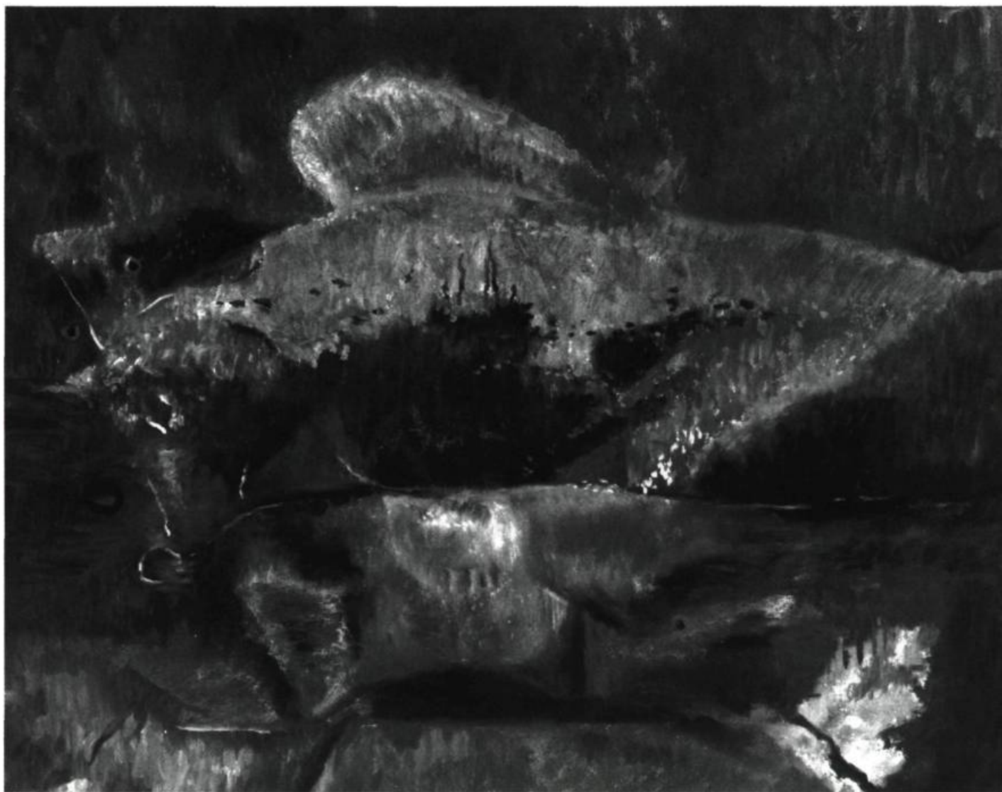
3. Sans titre (non daté). 61 cm x 76,2.

apparences n'est jamais une recherche du trompe-l'œil, de l'illusion de la réalité pour elle-même, mais, bien plutôt, une quête des signes qui renvoient à une profondeur, à une intériorité, à l'Esprit. Que l'on songe aux intenses Autoportraits de Van Gogh où il nous donne à palper son affolante anxiété, sa gravité devant la vie et la mort. C'est parce qu'ils se font une notion pour ainsi dire vicariante des apparences que les peintres romantiques peuvent passer soudainement à l'abstraction, tentative pour rejoindre directement l'Absolu après en avoir cherché si longtemps les signes à la surface des choses.