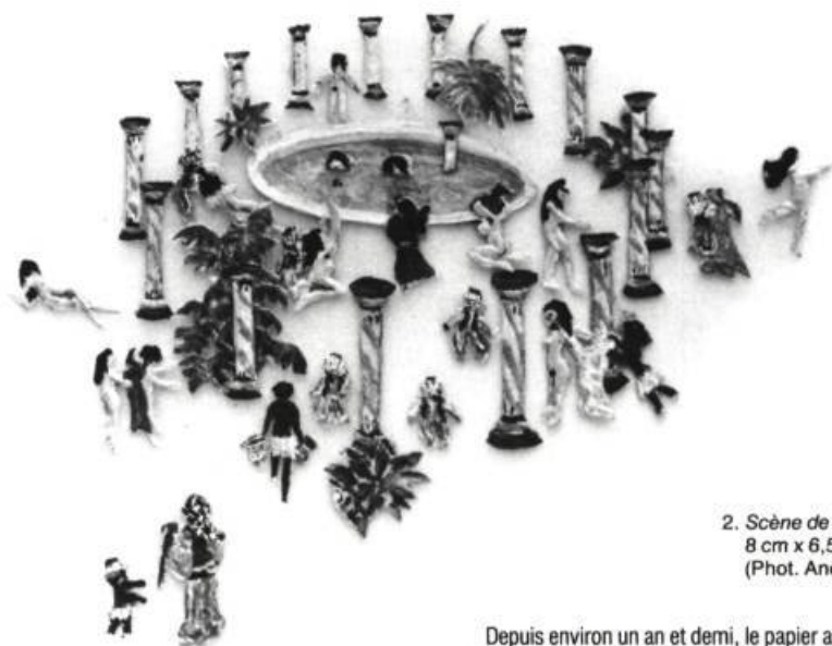
2. Scène de harem, 1982. 8 cm x 6,5.