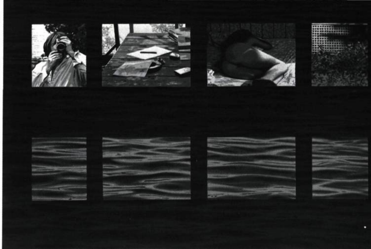
1. Edmund ALLEYN Blues to be there , 1983. Gouache; 100cm 9 × 66,7.