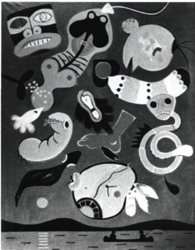
2. Au-dessus du lac N2 , 1964. Huile sur toile; 132cm × 182,8 env.