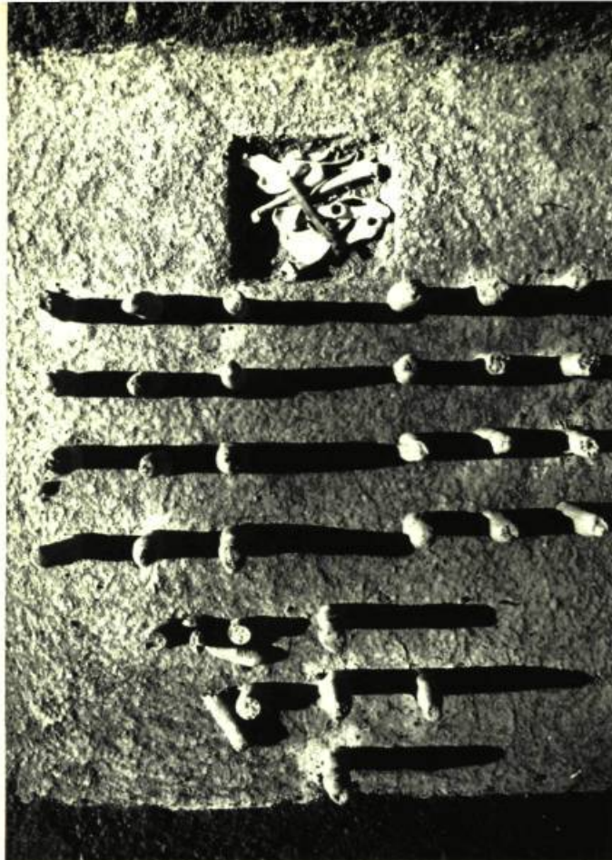
6. Reno SALVAIL Les Mées (vues d'avion).

rait sembler en conséquence la plus autonome dans son développement plastique, indépendante de toute autre stimulation imaginaire que locale. Or, il n'en est rien, et c'est peut-être, au contraire, celle qui touche au plus intime de la culture québécoise du sculpteur. Au premier moment