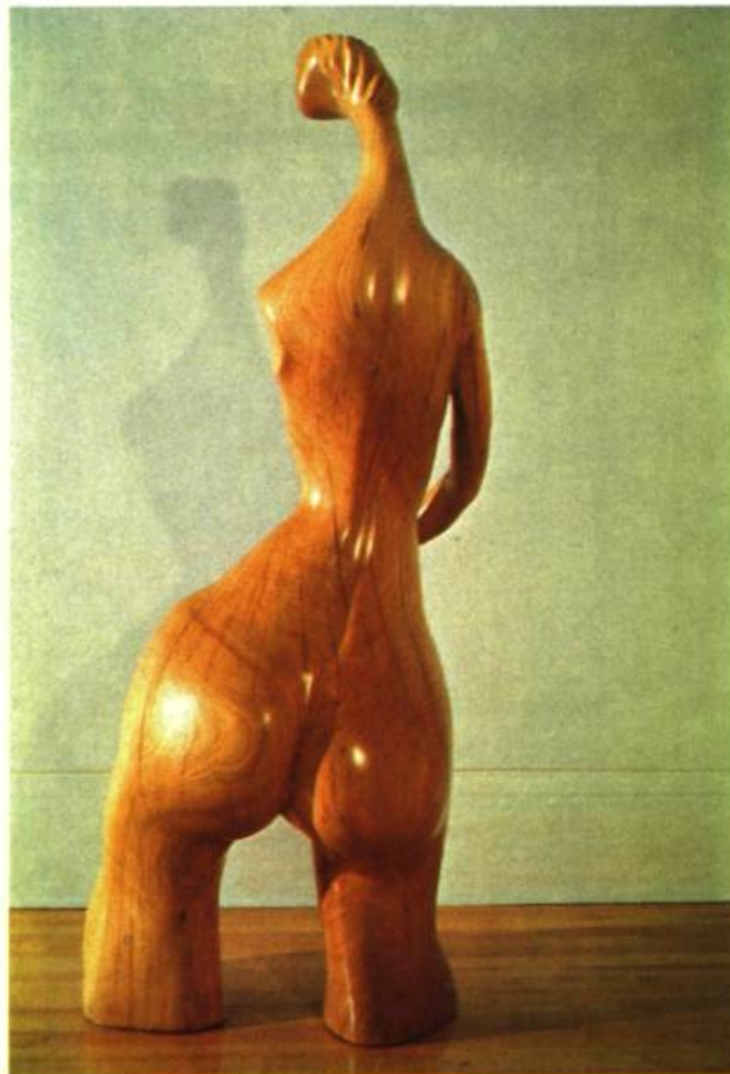
2. Femme N° 1. Bois d'orme; H.: 172 cm 7.

Aristide Gagnon, lui aussi, vous a bien compris. Devinant l'étoffe, il vous propose d'être son apprenti. Et ainsi la fonderie