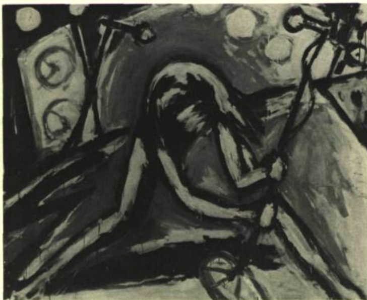
2. Helmut MIDDENDORF Chanteur rouge, 1981. 190cm x 230.

A Bruxelles, à l'occasion du vingt-cinquième anniversaire de l'Institut Goethe, le Palais des Beaux-Arts voue à l'École de Berlin une importante exposition regroupant une centaine de tableaux s'échelonnant sur trois décennies.