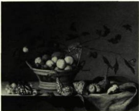
Balthus VAN DER AST

Jusqu'au 2 janvier: Jack Shadboit; Georg Baselitz; Jusqu'au 20 janvier: La Photographie aux Indes, aux 19 e et 20 e siècles; Du 1 er février au 17 mars: Biennale du Film et de la Vidéo; Jusqu'au 10 février: Peintures hollandaises; À partir du 22 février: Ching Yan Chai - Collection de peintures chinoises, du 15 e siècle à aujourd'hui; À partir du 9 mars: Photographies du quartier chinois de Vancouver, de 1886 à 1984; À partir du 15 mars: Routes de la soie et bateaux de Chine.