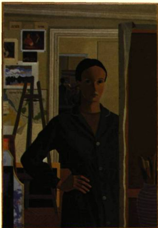
2. Autoportrait. Huile sur toile. Montréal, Coll. Lavalin.

1. Vol. XVI, N° 64, p. 38-41. Voir aussi l'article de Willie Chevalier, XIX, 78, 26-27. 2. A la Galerie Walter Klinkhoff.