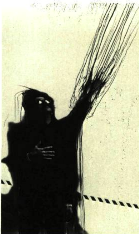
3. Claude LAMARCHE Pluie acide , 1984. Photo-peinture; 177cm 8 x 101,6.