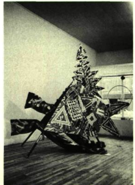
5. Claude-Paul GAUTHIER Objet Baroque Object , 1984. Techniques mixtes; 243cm 8 x 243,8 x 121,9.

La curieuse mise en scène d'Y. Cousineau intitulée L'Annonciation avait élaboré une stratégie de références multiples (sociologiques, artistiques, culturelles) par la disposition au sol de petites pancartes affichant des photographies diverses: affiches publicitaires, vedettes de cinéma et de la musique pop et rock, héros de BD, vedettes des arts visuels. La valeur culturelle que connotaient individuellement ces images avait été évacuée et mise littéralement sur le même plan, au sol. Il s'agissait d'une réification des images et des références par les mass média, dans ce qu'elles avaient originellement de singulier, d'unique. L'interchangeabilité qui résultait de cette mise en scène était sanctionnée par une figure peinte sur plexiglass, déesse pin-up, figure mythique d'une annonciation hollywoodienne qui légitimait ce fatras de références propres à un imaginaire urbain mass médiatisé. Avec ce petit jardin de culture(s), dans un écart qui participait davantage d'un humour raffiné que d'un esprit de catastrophe, Y. Cousineau signalait l'aliénation de l'imaginaire par l'évacuation de toute différence en plantant, côte à côte et indifféremment les figures de personnalités connues (Duchamp, Warhol, Presley,...) Toute figure, tout(e) héros(oïne) était présenté comme artifice, comme objet de consommation banalisé. Projet d'acculturation totale ou projet de mixage des cultures? La question restait ouverte.