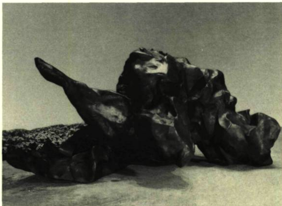
1. Willem De KOONING, Reclining Figure , 1969-1982. Bronze; 328cm 7 x 243,8 x 170,1.

Corps marouflé d'indécence, corps qui éructe, corps qui se soulage, éruption de muscles, de nerfs et d'os, réseau échelonné des veines, paysage de tuméfactions violacées, comme les peintres de la Renaissance, De Kooning traite le corps dans