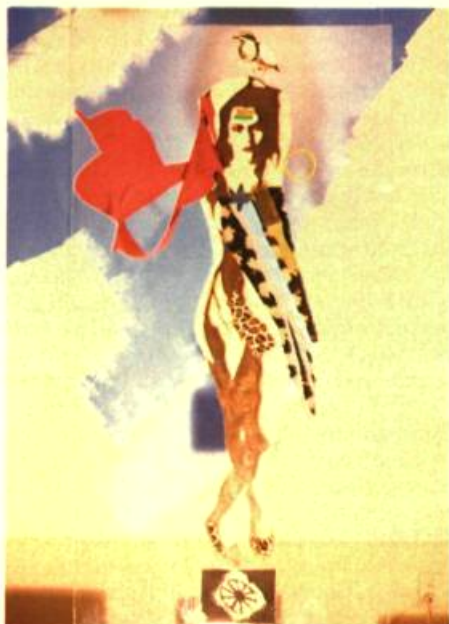
1. Yvon COUSINEAU L'Annonciation , 1984. Plexiglas, masonite, huile, tissus et photos; Environnement de 243cm 4 x 243,4 x 243,4 x 243,4.

Il est toujours intéressant de constater l'effet de clarification produit par et dans une exposition de groupe à propos du travail de chacun des artistes qui la composent et par le type d'unité qui la caractérise comme telle. En juin dernier, une exposition intitulée Multi-Media rassemblait, au Centre Copie-Art, à Montréal, des œuvres d'artistes qui, depuis plusieurs années, se sont manifestés individuellement en tant que performeurs dans des actions éphémères, dans des lieux ponctuels, tantôt excentriques aux institutions (places publiques, rues, atelier d'artistes), tantôt carrément officiels (Musée d'Art Contemporain de Montréal).