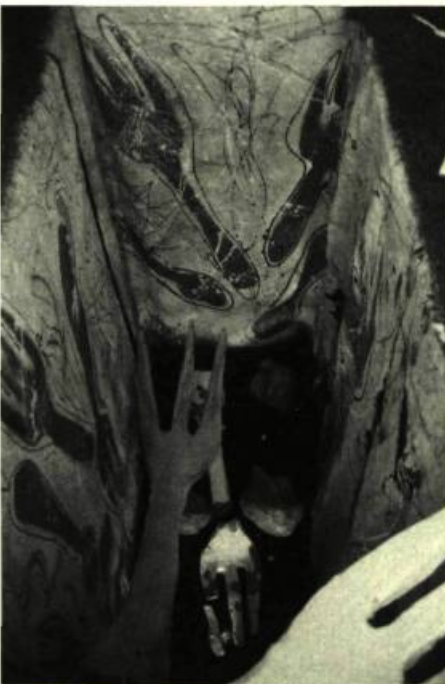
4. Jean-Pierre GAGNON Le Déjeuner sur l'herbe (détail) , 1984. Installation. Techniques mixtes.

cie les techniques et les disciplines, l'artiste ne s'est pas privé de porter un regard ironique sur le système des Beaux-Arts où la noblesse du sujet (nu féminin) – réduit à l'état d'objet – a si souvent témoigné de la puissance créatrice de l'artiste vu comme démiurge.