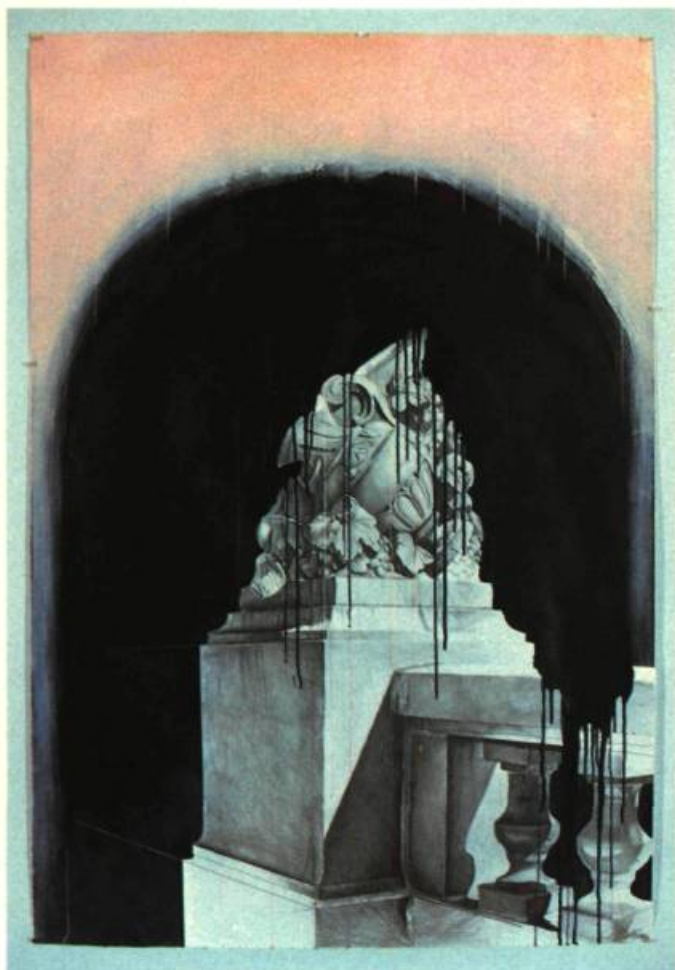
1. Paul BÉLIVEAU Grand débordement IV , 1983. Dessin et acrylique sur papier Arche; 183cm x 121. Ministère des Affaires Culturelles, Coll. Prêt d'œuvres d'art.

L'expression plastique, chez Paul Béliveau, s'est enrichie, depuis deux ans, d'une nouvelle sensibilité qui émerge de la conquête progressive, expansive de la couleur. Dans une pratique longtemps marquée par l'expérimentation rigoureuse du dessin, le travail technique de la lithographie et la prédominance du noir et blanc, voilà que s'insinuent, avec bonheur, les débordements d'une picturalité conquérante.