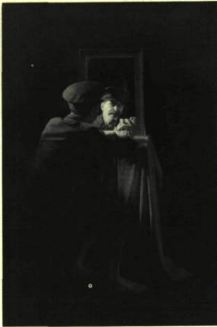
KOMAR & MELAMID