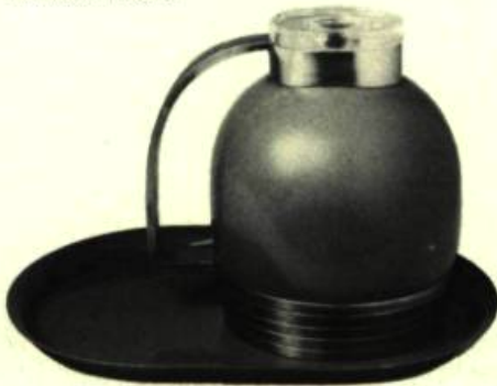
4. Henry DREYFUS Thermos et plateau, v. 1939. Métal et verre.

diale et le début des années soixante fut des plus propices au développement du design qui résultait de l'union de l'art et de l'industrie. Cette attitude pour le design tire ses origines du Bauhaus dont les idées de diffusion ne se réalisèrent cependant pas parce que la production usinée demandait une finition artisanale, donc trop coûteuse pour les masses qui, de toute façon, n'étaient pas initiées à l'avant-garde. D'ailleurs une grande partie de la production usinée des années cinquante était tirée de dessins d'avant-guerre. D'un autre côté, Eames et Mies van der Rohe travaillaient dans des directions opposées: Van der Rohe procédait par soustraction des éléments, et Eames, par addition, en ne retenant que l'essentiel autant sur le plan de la forme-fonction que de l'esthétique contemporaine. Cette approche ne fait pas disparaître les détails techniques mais, bien au contraire, les rend pleinement visibles.