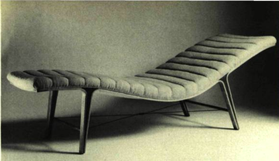
3. Edward WORMLEY Chaise longue, v. 1948. Cerisier, érable blanc, bronze et capitonnage en laine d'Éthiopie.

Au cours des années cinquante, l'on prit conscience qu'une bonne partie de notre vie se passait à attendre, que ce soit pour un rendez-vous, un avion, ou devant la télé. Certains sièges d'alors nous le rappellent: Fréquemment, il est impossible de s'y assoupir tant la rigidité de leur conception facilite l'attente éveillée! Souvent, on trouve, dans cette production, une tension, une agressivité des formes et des couleurs qui empêchent en effet toute détente. Cette idée d'une vie superactive se retrouve de nos jours, ce qui expliquerait l'engouement pour les années cinquante. L'intérêt suscité par cette période se présente sous deux aspects: une quantité énorme d'objets kitsch furent ressortis des greniers par le goût populaire, tandis que réapparaissaient des trésors oubliés qui témoignaient de l'évolution du design moderne et nous portaient à reviser nos conceptions esthétiques. La période qui sépare la fin de la Deuxième Guerre mon-