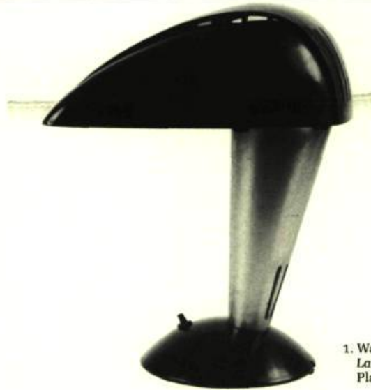
1. Walter Dorwin TEAGUE Lampe de travail, v. 1939. Plastique et aluminium.

Unique en son genre au Canada, la Collection de design d'après-guerre de Liliane Stewart entre au Musée des Arts Décoratifs de Montréal. Cet ensemble, qui comprend des pièces de mobilier, de la porcelaine, des objets en métal et des textiles, est représentatif du design international et regroupe les noms des grands créateurs de notre époque.