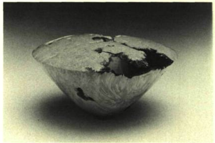
3. Wayne HAYES Turned Burl Bowl. Érable; 25 cm 4 de diamètre.

Dans les années 1960, une seconde vague d'immigrants, arrivant principalement des États-Unis, vint consolider l'œuvre amorcée. Ce deuxième groupe, dont un grand nombre étaient éminemment formés, apporta un nouveau dynamisme dans le milieu artisanal. Peter Powning en est un exemple type. Potier