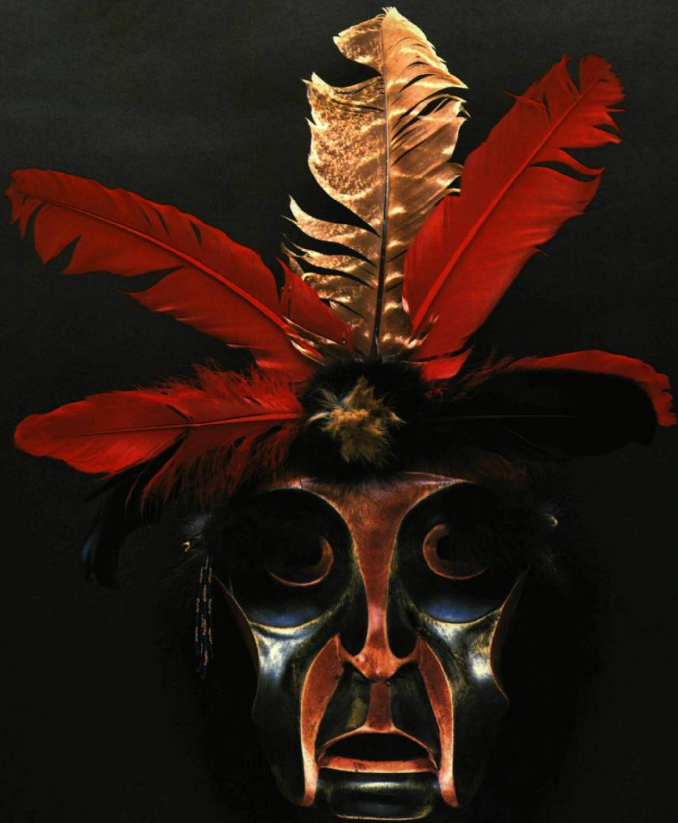
2. Nod BEAR Dance Mask. Pin sculpté et peint, plumes, métal et fourrure. Hauteur: 30 cm.