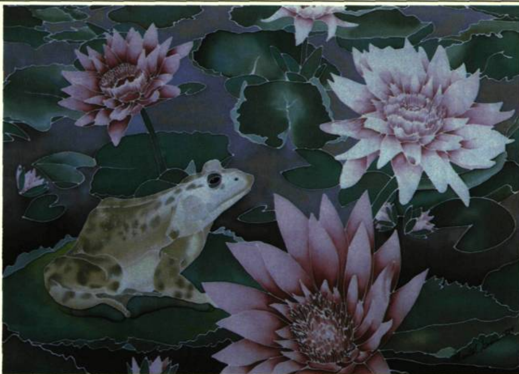
1. Chantal GODIN Frog and Waterlilies. Soie peinte; 38 cm x 30. Collection Provinciale du Nouveau-Brunswick.