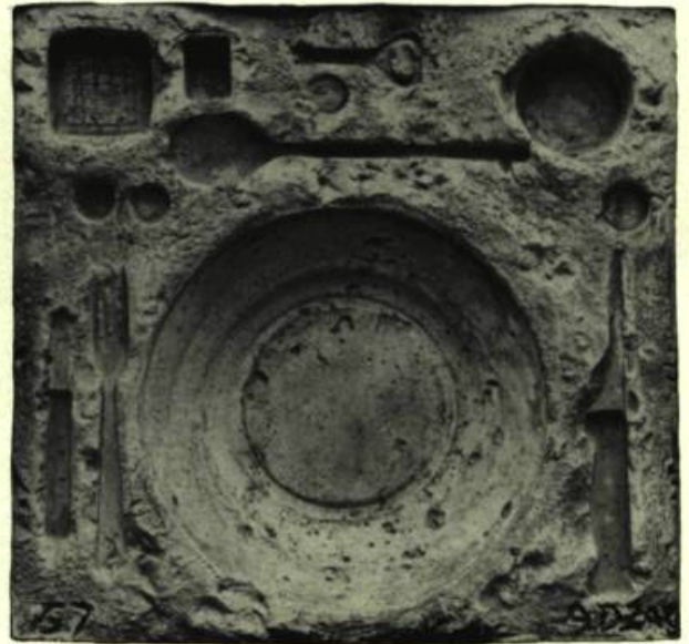
3. Couvert, série Archéologique, 1957.