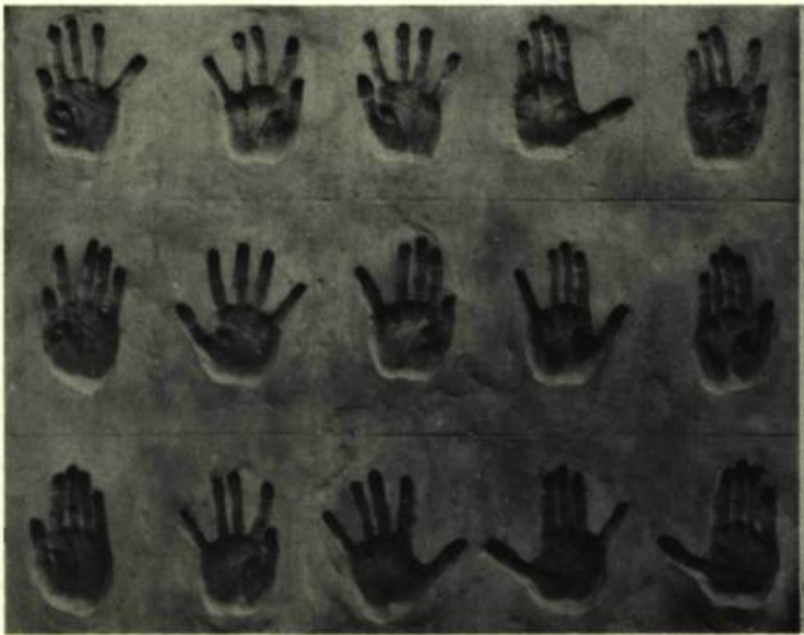
2. Langage des mains, objets en négatif, 1958.