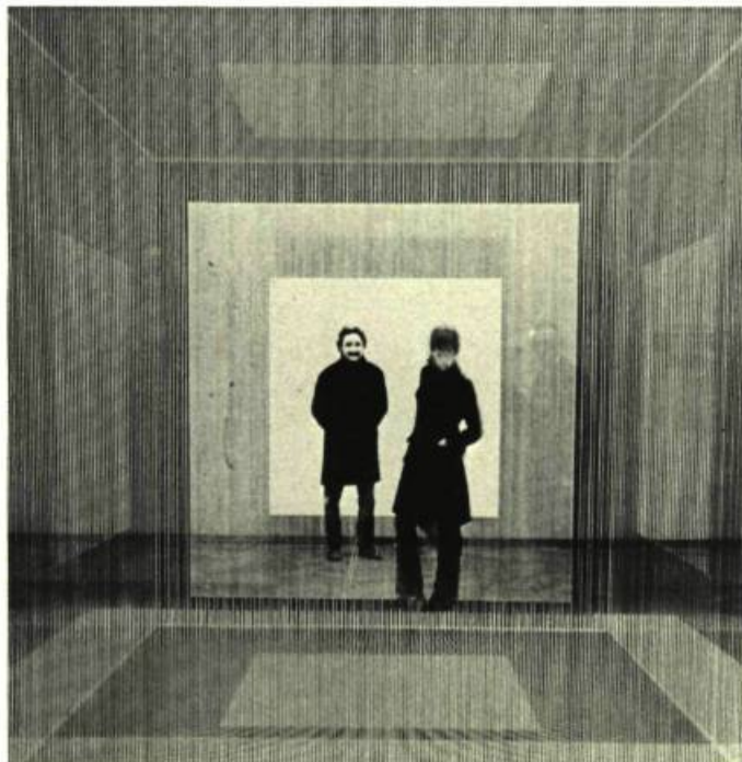
1. Jesús Rafael SOTO Cube de l'espace ambigu, 1969.

Ni plein: l'obstacle n'offre aucune résistance solide; ni vide: le regard ne rencontre qu'une masse homogène, apparemment sans limites, dès que l'on a franchi la lisière de la forêt de lianes plastiques. Le monde extérieur a reflué dans un lointain indéterminé. Il est brusquement devenu invisible ou fantomatique. L'être humain se meut à l'aveugle. Une lumière