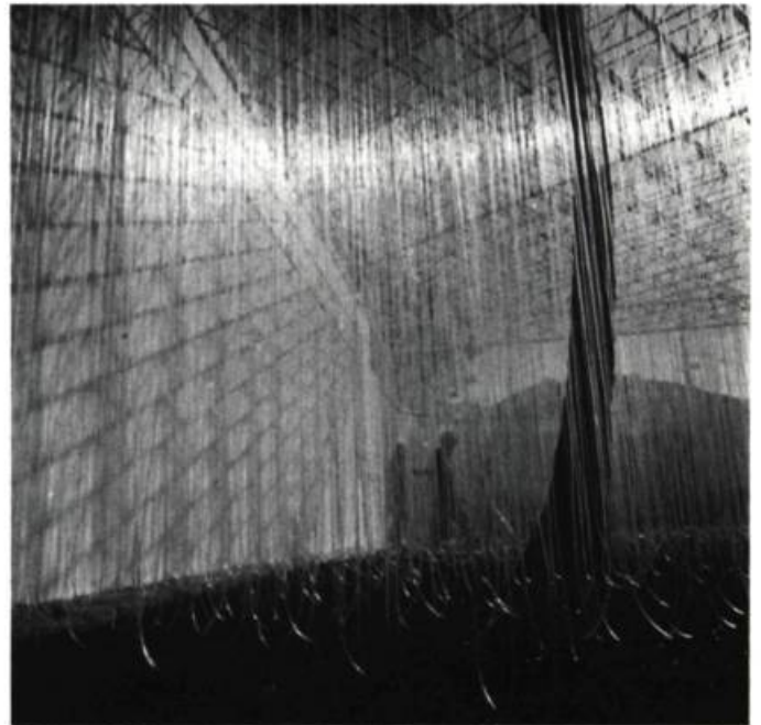
3. Pénétrable de Pampatas, 1971.

Dans le catalogue de l'exposition du Stedelijk Museum d'Amsterdam (1969), Soto insiste sur la notion de relations: «L'élément est un facteur secondaire que j'utilise pour rendre communicable ma notion de relation.» En prenant conscience des relations qu'il entretient avec ce qui l'entoure, l'homme prend conscience de lui-même et peut s'accepter tel qu'il est. C'est de cette acceptation que naît le plaisir procuré par l'œuvre d'art. Celle-ci, pour emprunter cette fois un terme à Lacan, se révèle une «orthopédie de la réalité». Elle fonctionne à la manière du miroir chez Lacan dans son analyse du stade du miroir . Elle est une sorte de miroir endo-psychique. Comme lui, elle «établit une relation de l'organisme à sa réalité – de l'Innenwelt à l'Unwelt».