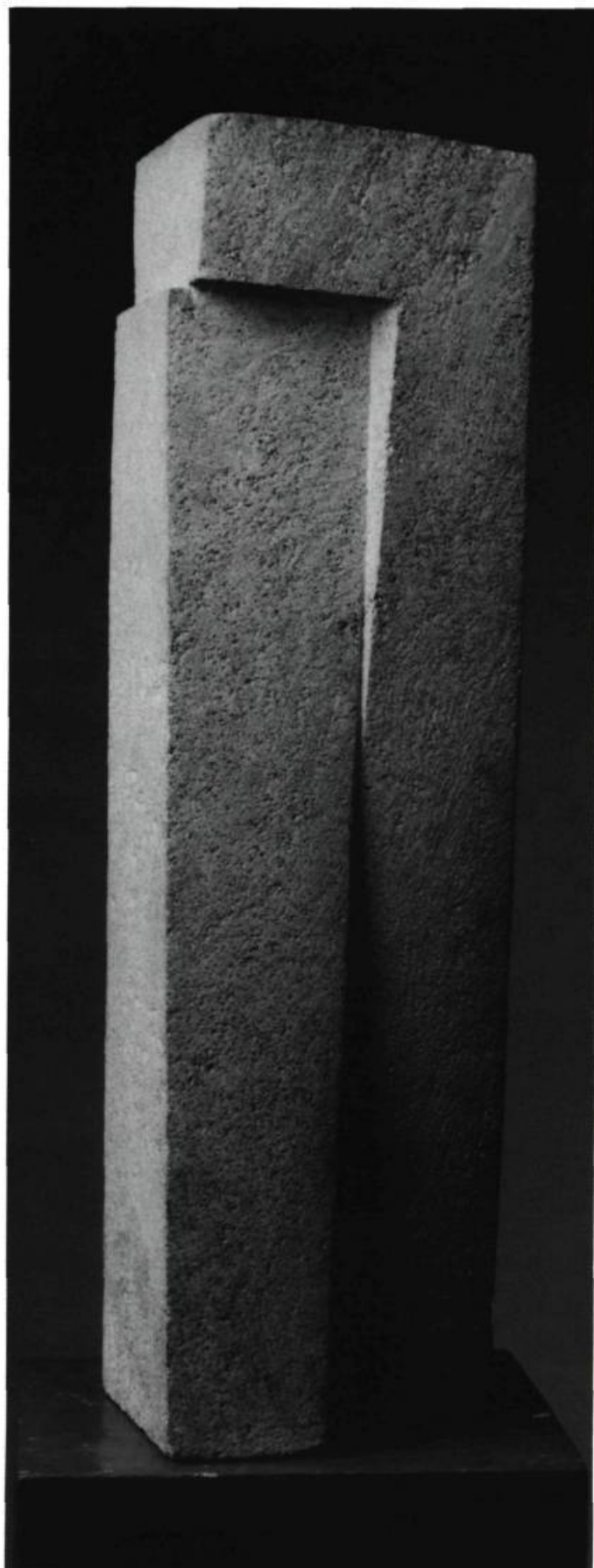
4. Sans titre, 1950. Pierre calcaire (taille directe); 59 cm x 16,5 x 12,5.