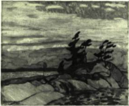
Alexander Young JACKSON