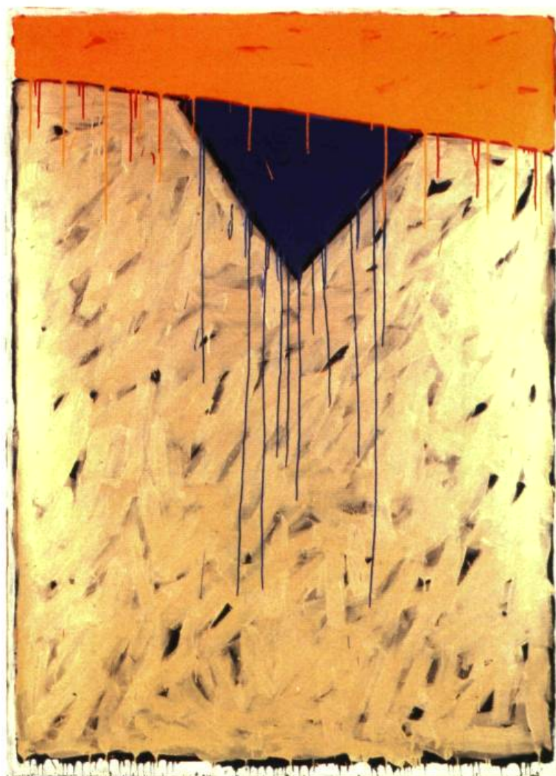
3. Triangle bleu, 1981. Acrylique sur toile; 2 m 13 x 1.52.