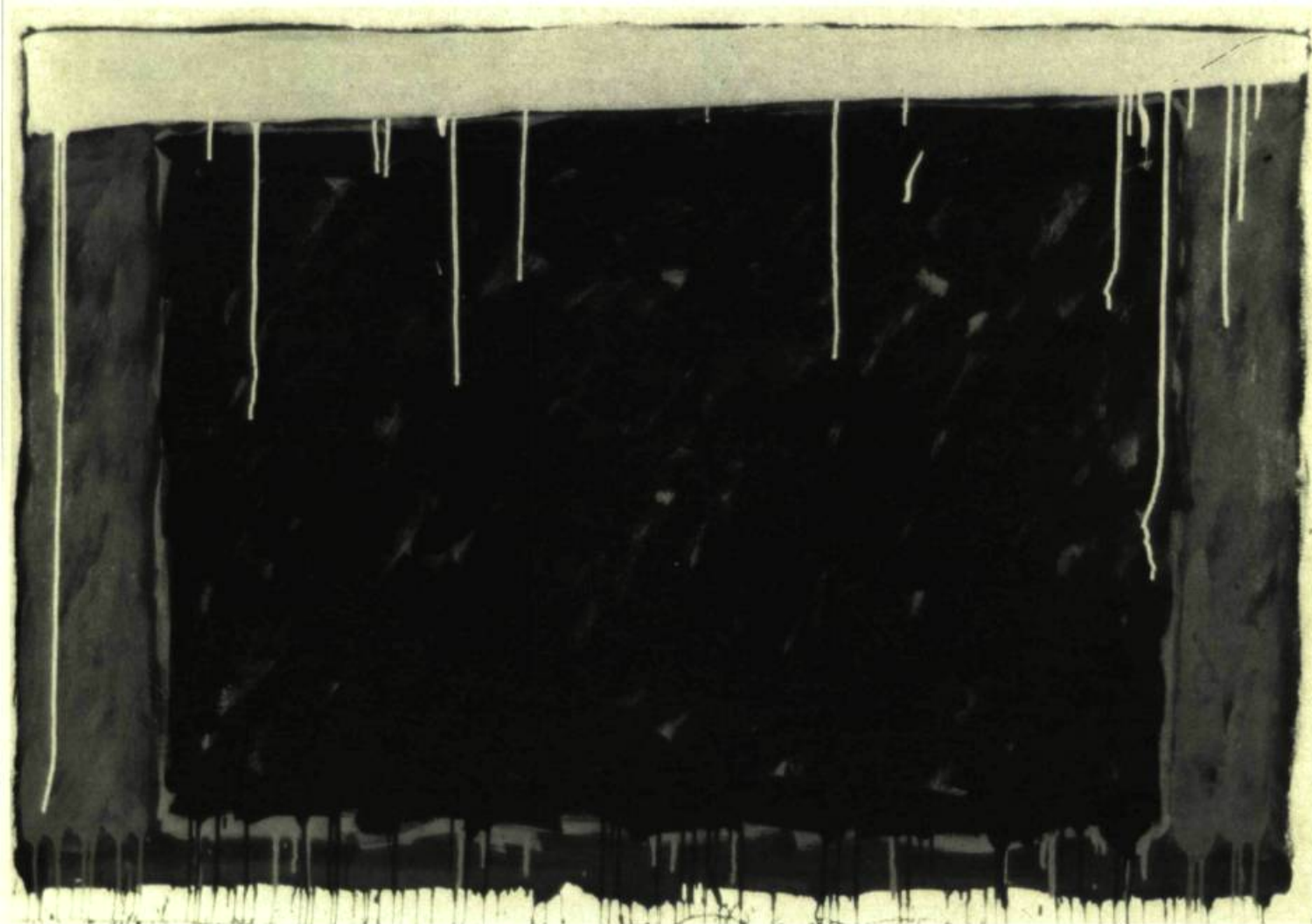
4. Rideau noir, 1982. Acrylique sur toile; 1 m 52 x 2,13

A travers cette rapide comparaison, on aura noté les caractéristiques permanentes de la peinture de Lemoine: Une peinture dynamique qui maintient le rapport illusionniste de l'avant et de l'arrière, de la forme sur un fond. Toutefois, et c'est là que Lemoine surprend encore, son fond joue d'illusion, car, si à première vue le triangle semble peint sur celui-ci, à suivre les coulées de peinture qui rencontrent la partie supérieure du