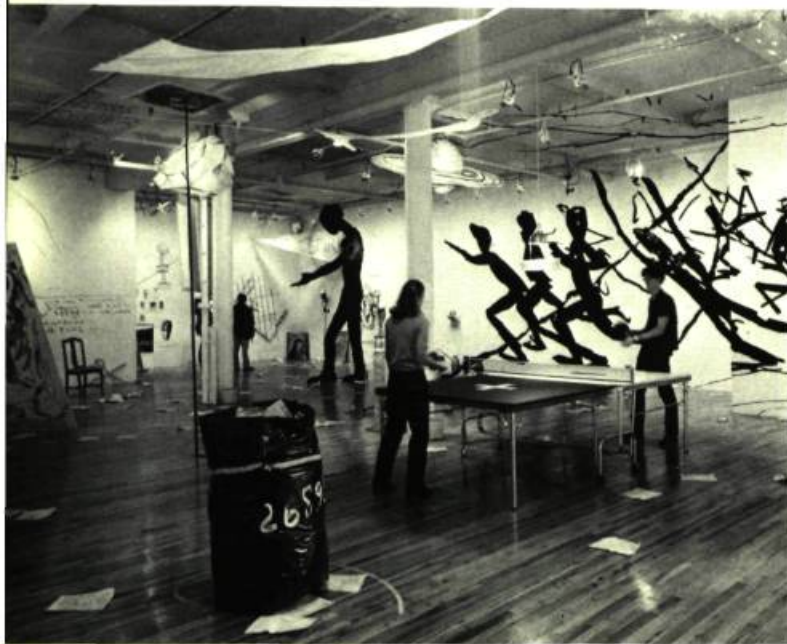
4. Jon BOROFSKY Installation. Paula Cooper Gallery.

part, et de l'art conceptuel introduit par ses prédécesseurs immédiats des années 60, d'autre part, s'ingénie-t-elle à produire dans cette nouvelle situation? Voilà les deux questions qui sous-tendent cet essai.