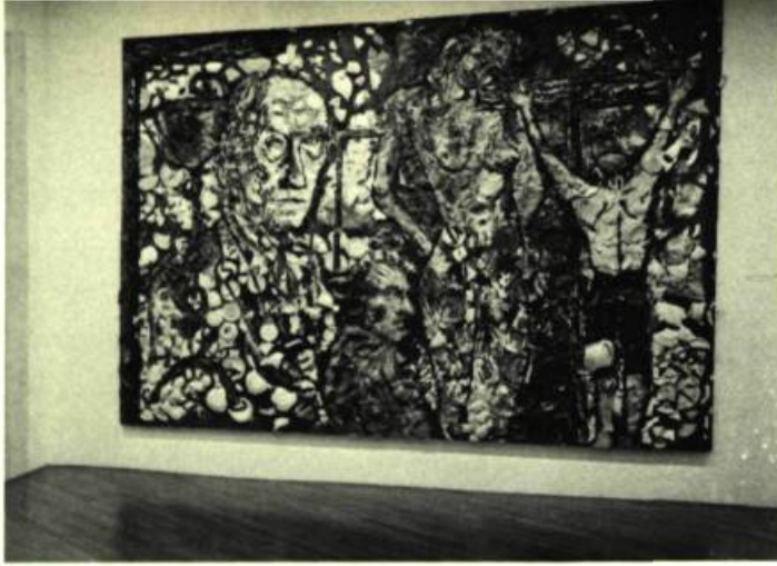
2. Julian SCHNABEL Tableau sans merci, 1981. Procédé mixte; 3 m 5 x 4,27. Installation. Mary Boone Gallery.