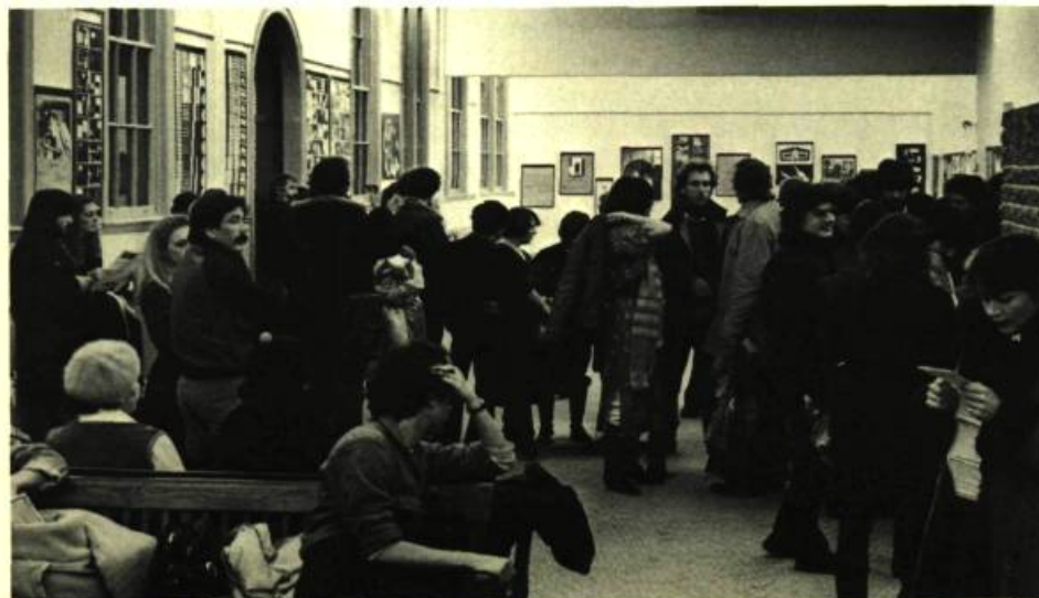
3. Salle d'exposition de la Maison du Cinéma.

Longue vie au travail fructueux de conservation et de diffusion de la Cinémathèque!