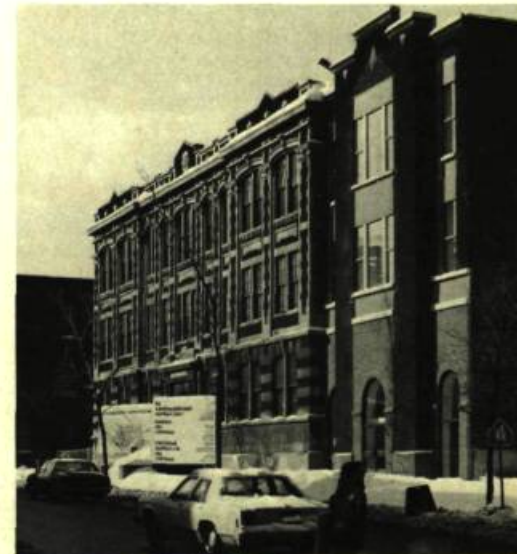
4. La Maison du Cinéma.

1045A, rue Shaw Toronto, Ontario M6G 3N2 Tél.: (416) 537-3937