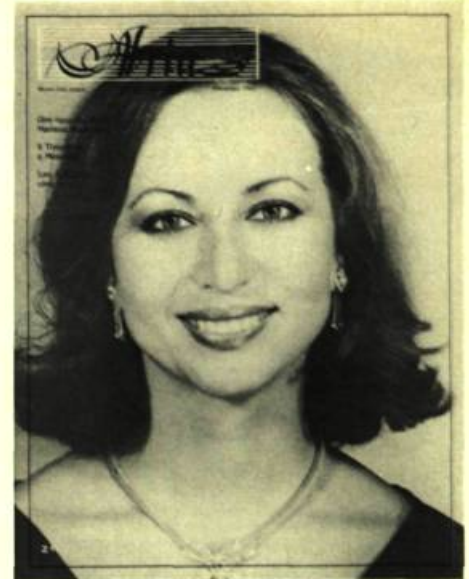
2. Page couverture du dernier numéro d'Aria.