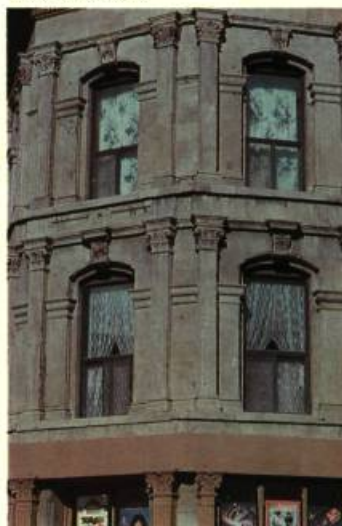
5. Exemple de l'utilisation d'un répertoire formel classique: ce bâtiment de la rue Saint-Jacques.