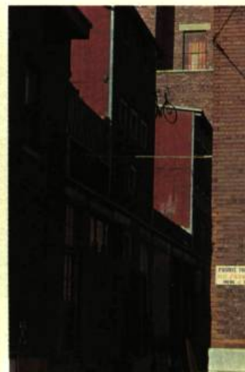
6. Un des nombreux aspects de Saint-Henri: l'allure cubiste de certains arrières de maison.