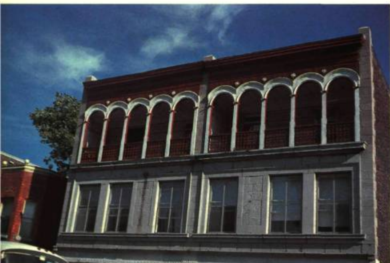
1. D'étonnantes surprises comme en réserve Saint-Henri: cette loggia située à l'étage supérieur d'une maison, rue Saint-Jacques.