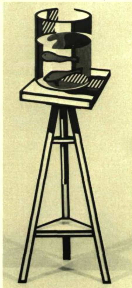
Roy LICHTENSTEIN

WHITNEY MUSEUM OF AMERICAN ART, 945, avenue Madison. Jusqu'au 15 novembre: Dessins récemment acquis; Jusqu'au 29 novembre: Roy Lichtenstein, 1970-1980; A partir du 28 octobre: Selections de la Collection permanente; A partir du 25 novembre: Gravures américaines de 1890 à 1980, Procédés et épreuves; A partir du 9 décembre: Sculptures en céramique de Robert Arneson, David Gilhooly, John Mason, Kenneth Price, Richard Shaw et Peter Voukos; En permanence: Le Cirque de Calder.