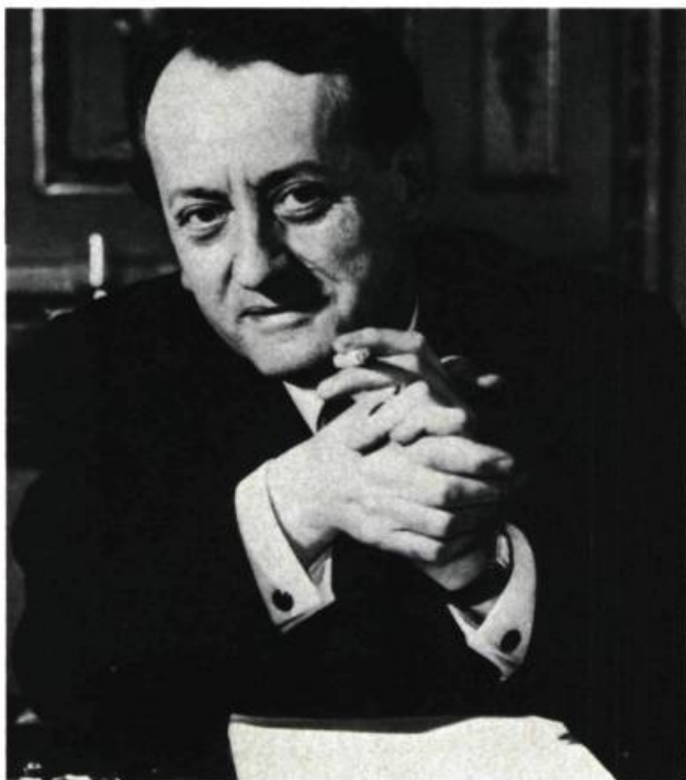
1. André MALRAUX alors qu'il était ministre de la Culture.

Je ne distingue pas le domaine de l'art des autres. La volonté de création artistique ne me semble pas plus s'opposer à la volonté de transformation du monde que la pensée scientifique... (André MALRAUX)